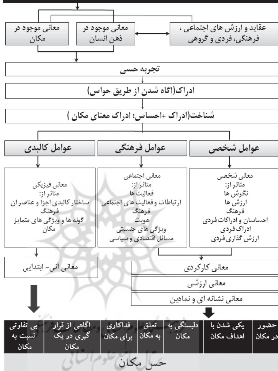
نمودار ۱. عوامل موثر بر شکل گیری حس مکان؛ ماخذ: نگارنده، ۱۳۹۴.

با مجموعه‌ای وسیع از کاربری‌ها و بناهای جنبی مرکز جنب و جوش شهرها و تعاملات اجتماعی بودند، در این بازارها علاوه بر انجام معاملات اقتصادی، بسیاری از رویدادهای اجتماعی، مذهبی و حتی سیاسی نیز رخ می‌داد، بازارهای ایرانی با پاسخگویی به بسیاری از نیازهای انسان محیطی با هویت و جذاب را ایجاد کرده بودند و با ایجاد خاطره، حس مکان، خلق معنی و ارتقا کیفیت محیط بسیاری از مفاهیم را تداعی می‌کردند، در این مکان است که فرد می‌تواند تعاملات اجتماعی برقرار کند و اوقاتی را به خوشی سپری کند، فضا را احساس و به ادراک محیط نائل آید که در نتیجه این فعالیت‌ها و رفتارهاست که تجارب و خاطره‌ها شکل می‌گیرد و حس مکان و دل‌بستگی مکانی حاصل می‌شود.