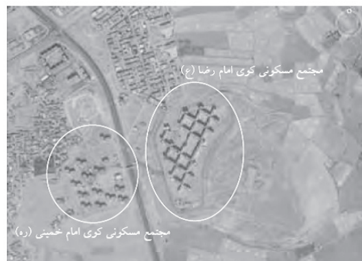
نقشه هوایی ۱. موقعیت مکانی مجتمع های مسکونی مورد مطالعه؛ ماخذ: گوگل ارث.