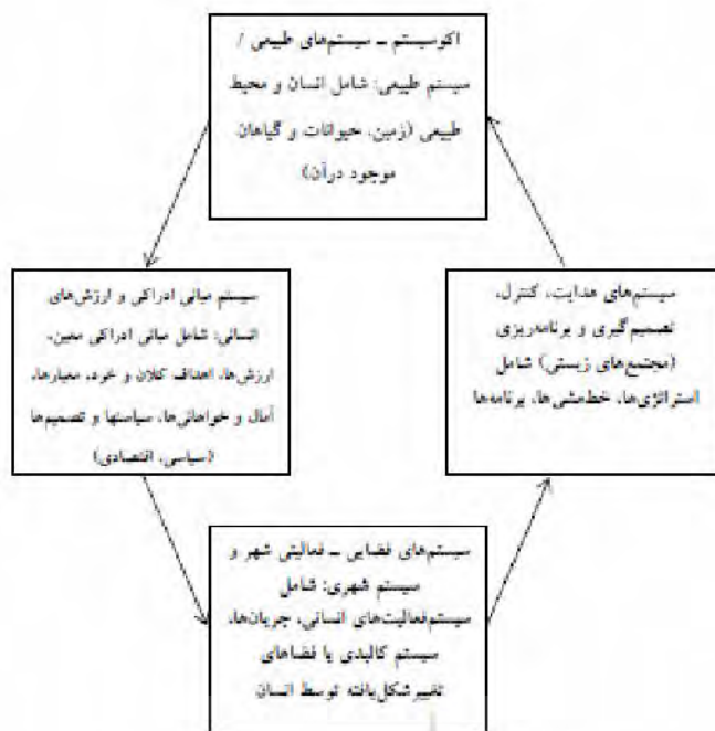
نمودار ۱. ویژگی‌های سیستمی و وضعیت آرمانشهری؛ ماخذ: نگارنده.

بشر باور داشت که علوم برای هر چیزی راه حلی خواهند یافت. قوانین نیوتن در مورد حرکت، درک و تحلیل بسیاری از پدیده‌ها را ممکن ساخته بود. در اثر رشد شتابان علوم در این دوره، اندیشمندان عصر روشنگری واقعاً به این نتیجه رسیده بودند که تنها زمان می‌خواهد تا همه قوانین و قواعد جامعه و محیط پیرامون بشر معلوم و آشکار شود. در همین دوران، بر خلاف گذشته که بیشتر اندیشمندان افق‌های کاملاً روشنی از آینده (آرمانشهر)، تصویر می‌کردند، تجسم‌های تیره‌تری از آینده نیز موجودیت یافت. آثار اندیشمندانی چون «اچ. جی. ول» ۱ ، «جورج اورول» ۲ و «آلدوس هاکسلی» ۳ از زمره چنین اندیشه‌هایی محسوب می‌شود و با چنین نمونه‌هایی است که کلاً آینده پژوهی راه خود را به ادبیات باز می‌کند. کامیابی خیره‌کننده رمان‌های «ژول ورن» ۴ و پا گرفتن سبک علمی تخیلی در ادبیات، در ادامه همین راه رخ می‌دهد. در تلاش‌های انسان