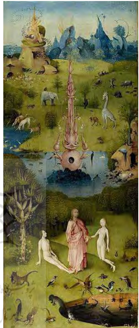
تصویر ۱ (سمت راست). باغ عدن اثر هیرونیموس بوش؛ ماخذ: ویکیپدیای فارسی، زمان اخذ: ۱۳۹۳/۴/۱۱

۴. «فاز چهار»: اشاعه نتایج و تدوین راهبردهای پیشنهادی؛ اشاعه نتایج و تدوین راهبردهای پیشنهادی اهمیت برابری دارند که بر حسب نوع و اهداف برنامه آینده نگاری تغییر می کنند.