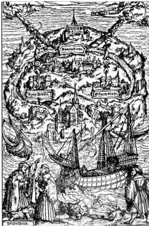
تصویر ۲ (سمت چپ). تصویری از اتوییا اثر تامس مور؛ ماخذ: ویکیپدیای فارسی، تاریخ اخذ: ۱۳۹۳/۳/۳.

شده، متغیرهای کلیدی برنامه مشخص می شوند. این فاز نیز خود شامل دو گام شناسایی و انتخاب گزینه می باشد: «شناسایی»: شناسایی کارشناسان، دست اندرکاران و افراد تاثیرگذار در فرایند و شناسایی مؤلفه های مربوط و زیربخش های موردنظر؛ درک و تبیین رسالت برنامه و «انتخاب»: دسته بندی افراد مرتبط با برنامه، انتخاب کارشناسان، ایجاد چارچوب مفهومی کلی که یک مدل مرجع برای فهم سیستم و پایه ای برای تصمیم گیری است.