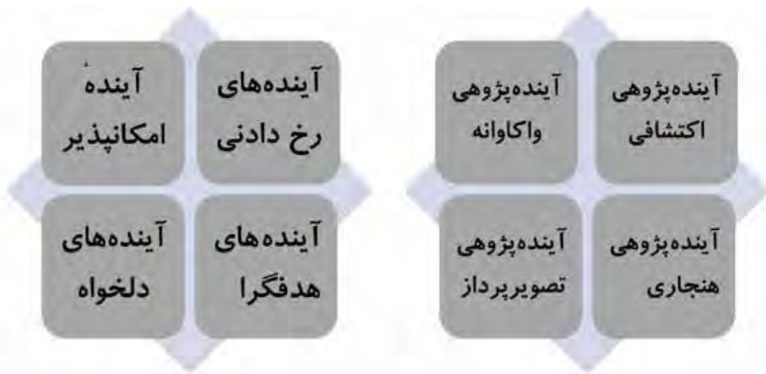
نمودار ۲. انواع آینده و انواع آینده پژوهی؛ ماخذ: ترسیم نگارنده.

ابتدایی و ساده است و به گونه‌ای ناخودآگاه از وضعیت موجود دفاع می‌کند و معتقد است آینده با علم و فناوری بنا نهاده می‌شود. این روش محافظه کار بوده و در عین حال بیش از حد مبتنی بر فناوری است و اغلب فاقد مفروضات لحاظ شده است؛ ۲. «آینده پژوهی مسئله محور»: این روش اخیر تلاش دارد با شناسایی و تعریف مشکلات و موانع، برای آنها راه‌حل‌هایی، هرچند ظاهری و غیرمتمن ارائه نماید؛ ۳. «آینده پژوهی انتقادی»: این روش اهتمام ویژه‌ای به تحلیل فرضیه‌ها، تصورات و پارادایم‌ها دارد. در روش انتقادی پس از مطالعه و بررسی بر روی محورهای یاد شده، تأثیر سوگیری‌های مختلف فرهنگی و سنت‌های تحقیق بر کار پژوهش آینده، مورد توجه قرار می‌گیرد؛ ۴. «آینده پژوهی معرفت شناسانه»: این روش می‌کوشد تا ثابت کنید که مشکلات و گرفتاری‌های ما ریشه در نگرش ما به جهان و راه‌های شناختی ما داشته و راه‌حل‌ها نیز از دگرگونی‌های نهفته و غیرقابل پیش‌بینی در این سطح ناشی می‌شود.