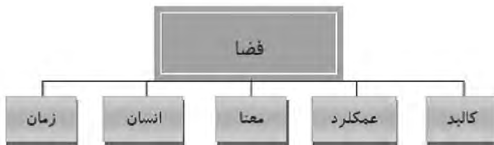
نمودار ۱. اجزاء اصلی شکل دهنده فضا؛ ماخذ: نگارندگان بر اساس مدنی پور، ۱۳۹۰.