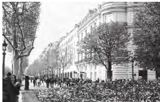
تصویر ۵. شانزه لیزه و بلوارهای پاریس؛ ماخذ: آرشیو نگارندگان.

و در آینده به نقدهای جان‌دار فیلسوفان قرن بیستم کشیده می‌شود.