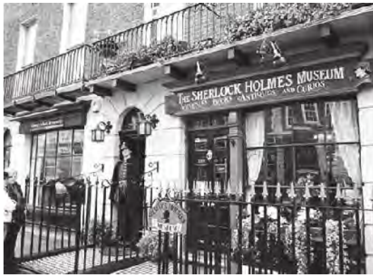
تصویر ۴. خیابان بیکر در لندن؛ ماخذ: آرشیو نگارندگان.

معمار انگلیسی در قرن هجدهم ساخته. این خیابان در گذشته یکی از مناطق لوکس و گرانبیام و خوش‌نشین لندن بود اما در حال حاضر بیشتر کاربری تجاری دارد. جالب اینجاست که یکی از بزرگ‌ترین و حرفه‌ای‌ترین و مرموزترین دزدی‌های تاریخ، دزدی از بانک لوید در سال ۱۹۷۱ در این خیابان اتفاق افتاده. چه‌بسا اگر داستان دوئل واقعی بود، هیچ‌وقت دزدان معمولی جرات نمی‌کردند که به خانه‌ای در همسایگی آقای هلمز دستبرد بزنند؛ مگر اینکه در حد و اندازه‌های تبهکاری چون پروفیسور موریاتی که آن هم ساخته و پرداخته ذهن دوئل است، بوده باشند.