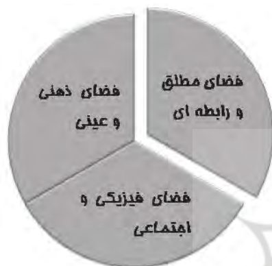
تصویر ۱. انواع فضا از دیدگاه فلسفی؛ ماخذ: نگارنده بر اساس افروغ، ۱۳۷۸.

شود و باید در یک عملیات راه حل یابی آن را به کار گرفت. تعداد بسیار زیادی از چنین عملیاتی بر پایه فرضیاتی شکل می گیرند که به ارزشیابی نقادانه نیاز دارد و برخوردی آگاهانه تر با فضای شهری موجود را می طلبد. بنابراین صرف نظر از وسایل نظری و عملی همزاد با رابطه میان دانش و کنش به ویژه در مبحثی به پیچیدگی فضای شهری، این کاری است که باید به فوریت درباره فرآیندی چون طراحی انجام شود که اغلب رمزگونه و بالقوه بحث برانگیز است.