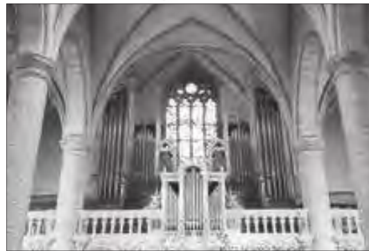
تصویر ۳. کلیسای نوتردام پاریس

کلیسای نوتردام از آثار فاخر در حوزه معماری است که تبدیلی بی‌بدیل از ساختار معماری را به ذهن متبادر می‌کند. «گوژپشت نوتردام» ویکتور هوگو آنقدر در سراسر جهان شهرت دارد که به اعتبار این شهرت، این کلیسا که خود نیز به اندازه کافی اعتبار تاریخی دارد، از آشناترین و معروف‌ترین کلیساهای تاریخ دنیاست. کلیسای جامع نوتردام در جزیره سیتیه در میانه رود سن و در مرکز پاریس واقع شده است. هر سال حدود ۱۳ میلیون نفر از این کلیسا بازدید می‌کنند. تا قبل از قرن چهارم میلادی در محل این کلیسا، معبدی قدیمی وجود داشت. کلیسای نوتردام تا مدت‌های طولانی بزرگ‌ترین کلیسای اروپا بود و گفته می‌شود ساختمان آن زیباترین اثر معماری گوتیک در دنیاست. برج‌های دوقلوی این کلیسا در رمان ویکتور هوگو، محل زندگی کازیمودوی گوژپشت و ساده‌دل و مهربان است. هرکدام از این برج‌ها ۶۹ متر بلندی دارند و کازیمودو هر روز مجبور است برای رسیدن به بالای آنها از ۳۸۰ پله بالا برود. طول و عرض ساختمان ۱۳۰ در ۴۸ متر بوده و سقف آن روی ۷۵ ستون بنا شده و بلندترین نقطه زیر سقف، ۴۳ متر از سطح زمین ارتفاع دارد.