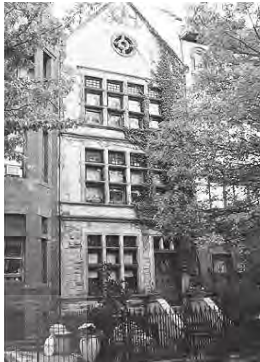
تصویر ۶. کلیسای کومبره؛ ماخذ: آرشیو نگارندگان.

و از هر ساختمان دیگری هم در هر کجای دنیا الهام می‌گرفت، آن منطقه و آن ساختمان، امروز به‌جای کومبره نشسته بود. پروست وصفی بسیار طولانی درباره کلیسای کومبره دارد؛ وصفی که کمتر می‌توان نمونه آن را در تاریخ ادبیات سراغ گرفت: «کومبره از دور از هفت‌فرسنگی، از راه‌آهن هنگامی که در آخرین هفته پیش از عید پاک به آنجا می‌رسیدیم چیزی بیش از یک کلیسا به‌نظر نمی‌رسید که چکیده و نماینده شهر بود. از شهر و به جای آن برای دوردست‌ها سخن می‌گفت... شیشه‌نگاره‌هایش هیچ‌گاه به زیبایی نوازشگرانه روزهایی نبود که خورشید کم می‌تابید. به‌گونه‌ای که با همه تیرگی هوای بیرون شک نداشتی که هوای درون کلیسا خوش بود...» ممکن است برای هر کسی این سوال پیش بیاید که آیا به‌راستی کلیسای کومبره اینقدر مهم است؟ همین که پروست به‌سراغ آن رفته نباید در اهمیتش تردید کرد.