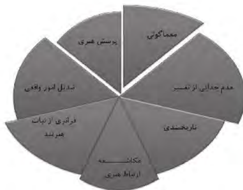
نمودار ۲. مبانی هرمنوتیکی از تباط و پیوستاری ادبیات داستانی و معماری؛ ماخذ: یافته‌های پژوهش.

اسلامی نقش اصلی و عمده ای داشته و دارد با نگاهی به جایگاه ادبیات می‌توان ارتباط مضامین، ویژگی‌ها و شاخصه‌های اجتماعی و فرهنگی معماری و ادبیات هر دوره را شناخت. از گذشته تا امروز همواره رابطه مفهومی میان داستان‌ها و قصه‌ها با معماری وجود داشته است محوریت یک مفهوم مشخص و واحد داشته به گونه ای که در ابتدا خلق فضا سپس پویایی و حرکت در فضا و بکارگیری احساسات منبعی برای الهام هنرمندان در هر دو حوزه هنری بوده است این مفاهیم در فضای دو هنر تا جایی بوده است و در حال نیز ادا می‌دارد آنچنان که با قرار گرفتن در کلیسای معروف نتردام ما به یاد نوشته‌های معروفی که در باره این مکان بوده است افتاده و گویی اینکه شخص زمانی که در این فضا قرار می‌گیرد می‌تواند خود را جای شخصیت اصلی قصه گذارده و ذهن خود را در فضا حرکت دهد. در انتها می‌توان گفت میزان اثر گذاری هر یک از این هنرها بر دیگری بسیار قابل بحث است، چگونگی شناخت و خلق فضا توسط هنرمندان گذشته می‌تواند یاری دهنده هنرمندان دوران‌های بعد باشد. نتیجه دیگری که می‌توان از این بحث گرفت این است که در قصه‌ها عمود خیمه‌ها درام است اما در داستان ما بحث درام را نداریم و این ارتباط بیشتر بین معماری و ادبیات دوران غیر مدرن وجود داشته است. معماری مدرن غیر دراماتیک است ما تا زمانی که در فضای دراماتیک معماری قرار نگیریم چیز زیادی برای ادراک قصه‌های درام نخواهیم داشت؛ به این دلیل است که معماری دوران گذشته با قصه‌های بیان شده ارتباط نزدیک تری از نظر مفهومی داشته‌اند.