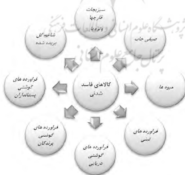
شکل ۱. دسته‌بندی کالاهای فاسدشدنی با توجه به توجه به تقاضای حمل در جاده‌های کشور؛ ماخذ: نگارندگان.

ضرورت توجه به حمل مواد فاسدشدنی و به خصوص مواد غذایی که سهم عمده‌ای از گروه کالاهای فاسدشدنی را به خود اختصاص می‌دهد، در پایه‌ای ترین نگاه به دو دلیل است: ۱- ایمنی یا بهداشت غذایی ۱ ۲- کاهش ضایعات در سیستم حمل و نقل. رعایت استانداردهای تولید، نگهداری، حمل و عرضه کالاهای فاسدشدنی به دلیل کاهش ضایعات، از نظر اقتصادی نیز هدف مهمی برای اقتصاد ملی محسوب می‌شود. این مساله به خصوص در مورد مواد غذایی به دلیل حجم انبوه آن قابل توجه است. توجه به کاهش ضایعات کالای فاسدشدنی و به خصوص مواد غذایی، مساله‌ای بین‌المللی است. بر اساس آمار سازمان خواروبار جهانی مقدار ضایعات مواد غذایی در کشورهای آمریکای لاتین به ۳۳ درصد و در آفریقا به ۴۰ درصد بالغ می‌شود [۱]. در ایران نیز به طور متوسط ۳۵ درصد از محصولات کشاورزی در زنجیره تولید- توزیع ضایع می‌شود که این، خود غذای ۱۵ تا ۲۰ میلیون نفر از جمعیت کشور است