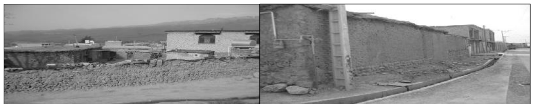
شکل ۴. قرار گرفتن بافت و معماری سنتی و مدرن در کنار هم در روستاهای باغبه‌زاد و جوانمردی؛ ماخذ: عکسبرداری نگارندگان.