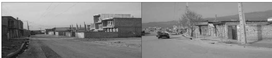
شکل ۲. تحولات فضائی متأثر از اجرای طرح هادی؛ ماخذ: عکسبرداری نگارندگان.

دهی به بافت مسکونی و ایجاد هویت کالبدی روستاهاست. کاربرد مصالح بومی در معماری روستایی، حاکی از هماهنگی و همساز بودن تحولات ساختاری - کارکردی با جغرافیای محل و استفاده از امکانات طبیعی آن است. در نحوه‌ی شکل‌گیری شبکه معابر روستایی در روستای جوانمردی نیز، در گذشته به دلیل کمبود وسایل نقلیه موتوری و کمی عبور و مرور، روستا دارای یک خیابان اصلی با عرض کم و چندین کوچه و معابر فرعی بوده است. عبور و مرور مردم و احشام آنها از طریق این معابر صورت می‌گرفته است و در ناحیه جنوبی و غربی روستا نیز مزارع روستا واقع شده بوده‌اند. در سالهای پس از انقلاب به صورت خودجوش در بافت جدید روستا، معابر عریض‌تر از گذشته ایجاد شدند. در ساخت مساکن نیز از مصالح جدید، بادوام و نیز متناسب با اصول مهندسی ساختمان استفاده می‌شود. از جمله این مصالح می‌توان به آجر، سیمان، تیرآهن، استفاده از اسکلت بتونی با میلگرد و بتون، استفاده از قیر و گونی و پوشش‌های سقفی ایزوگام و سایر عایق‌های رطوبتی مرغوب می‌توان اشاره کرد. در روند توسعه فیزیکی این روستا به دلیل افزایش جمعیت، بدون نظارت دولت، ساخت و سازها در جهات شرق و جنوب روستا انجام گردید و نیز بافت قدیم روستا نیز به صورت جدید و با معماری جدید در ناحیه غربی روستا بازسازی شد و به طور کلی تغییرات اساسی در بافت و مساکن روستا شکل گرفت. در سالهای دهه ۷۰، به دنبال اجرای طرح هادی روستایی توسط بنیاد مسکن شهرستان لردگان در روستا، توسعه فیزیکی روستا تا حدودی کنترل گردید و شبکه معابر اصلی روستا، اصلاح و بهسازی گردیدند. روستای باغبهزاد نیز به عنوان یکی از روستاهای پرجمعیت و با سابقه تاریخی بیش از ۱۵۰ سال در منطقه