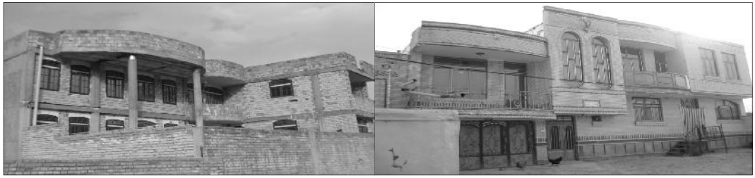
شکل ۳. الگوپذیری مساکن روستائی از معماری شهری

سویه که از آن با عنوان پیوندهای روستا- شهری یاد می‌شود، ویژگیهای اجتماعی و فرهنگی روستاها نیز متحول گردیده‌اند و به دنبال آن بافت و مسکن روستایی نیز از این عوامل متأثر شده‌اند. افزایش ارتباط بین شهرها و روستاها و الگوبرداری از زندگی شهری، در دهه‌های اخیر، باعث تغییر ساختار خانواده از گسترده به هسته‌ای و دگرذیسی فضاهای مسکونی روستایی شده است و بسیاری از خانواده‌ها به جایگزین کردن الگوهای مسکن شهری به جای خانه‌های موجود روی آورده‌اند. در شکل ۳، به ترتیب الگوپذیری مساکن روستائی از معماری شهری به ترتیب در روستاهای باغبه‌زاد و جوانمردی نمایش داده شده است.