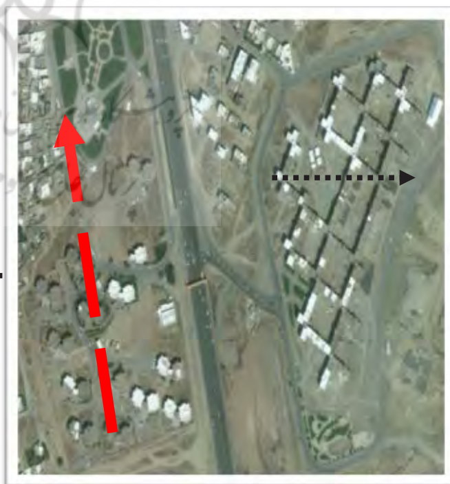
نقشه ۱. عکس قرارگیری نمونه های مورد مطالعه، منبع: نگارندگان.

با مطالعه میدانی و انتخاب نمونه های موردی این حس و عوامل تاثیرگذار آن مورد بررسی قرار گرفت. دو نمونه برای پژوهش انتخاب شد. مجتمع امام رضا و مجتمع امام خمینی که هر دو در شهرک مدنی