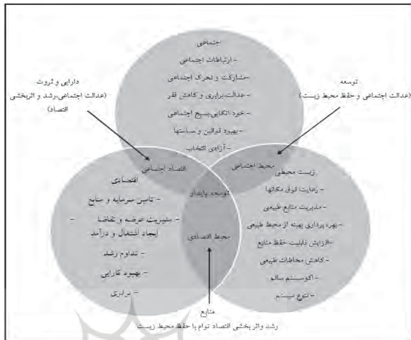
نمودار ۱. مدیریت روستایی با دیدگاه توسعه پایدار؛ ماخذ: افتخاری و دیگران، ۱۳۸۶، ص ۱۳؛ واسمیت، ۱۹۹۵.