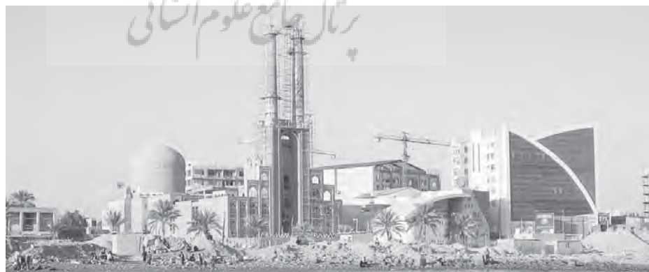
تصویر ۳. سبک‌های متفاوت و همجواری ناسازگار معماری در ساحل بندرعباس؛ ماخذ: نگارندگان، آذر ۱۳۸۹.