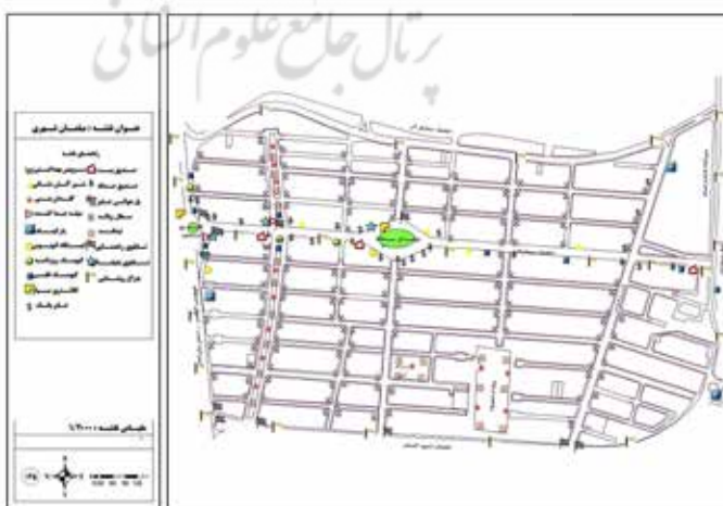
نقشه ۲. عناصر مبلمان در محدوده مورد مطالعه