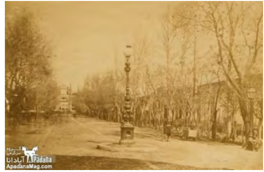
شکل ۱. خیابان باب همایون