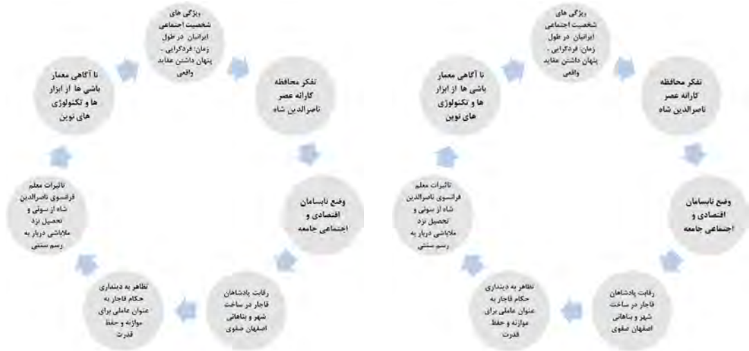
نمودار ۱. مهم ترین عوامل تاثیر گذار بیرونی در دوره قاجار