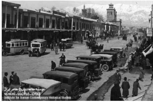
شکل ۲. خیابان ناصریه: ناصر خسرو