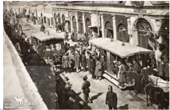
شکل ۳. خیابان چراغ گاز (امیر کبیر)

۲ - خیابان ناصریه (ناصرخسرو)؛ ۳ - خیابان چراغ گاز (امیرکبیر)؛ ۴ - خیابان لاله‌زار؛ ۵ - خیابان علاء الدوله (فردوسی)؛ ۶ - خیابان باغشاه (سپه) (مهدیزاده، ۱۳۸۱، ص ۲۲).