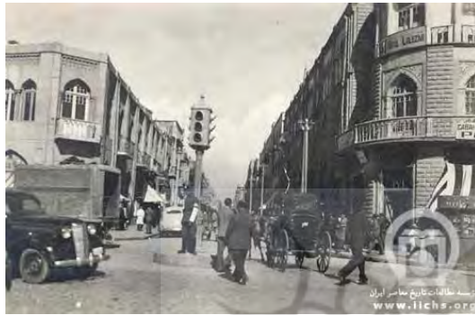
شکل ۴. خیابان لاله زار