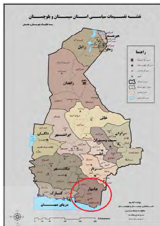
شکل ۳. موقعیت چابهار در استان سیستان و بلوچستان.

یکی از ویژگی های مهم پرسشنامه، انتخاب نمونه آماری مناسب به لحاظ سنی است. پاسخ دهنده گان باید از لحاظ سنی در شرایطی باشند که بتوانند موضوع تحقیق را بطور ملموس درک کرده و در مورد آن اطلاعات کافی داشته باشند. در این شرایط نوجوانان و کودکان و افراد سالمند نسبت به سایر گروه های سنی اطلاعات کمی از موضوع و شرایط حاکم دارند و بنابراین انتخاب جوانان و افراد میانسال که در بطن فعالیت های اجتماعی و اقتصادی بندر چابهار هستند، نقش مهمی در رسیدن به نتایج درست و مطلوب دارند. از اینرو در این پژوهش سعی شده است که جوانان و افراد میانسال مخاطبان مصاحبه و توزیع پرسشنامه باشند. برای تحلیل و طبقه بندی گروههای سنی نیز، یک گروه بندی ۴ طیفی ارائه شد. طبق جدول سه، دو گروه ۳۰-۳۹ سال با ۴۵,۵ درصد و ۲۰-۲۹ سال با ۳۴,۵ درصد بیشترین تعداد برای توزیع پرسشنامه انتخاب شدند. از اینرو، بیشتر افراد جامعه آماری، افراد جوان و