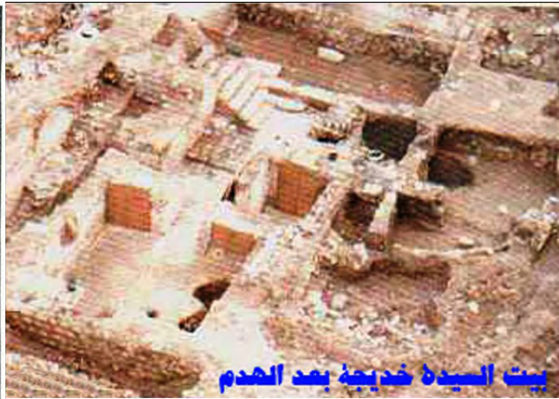
تصویر ۱. خانه ی حضرت خدیجه (س) در مکه و فضاهای خصوصی و فضای پذیرش مهمان در خانه؛ ماخذ: قربانی، بی تا، ص ۴۸.

۲). و در جای دیگر اینگونه آمده است: «سلام ما را به دوستان و موالی ما برسان و آنها را به تقوای الهی سفارش فرما... و اینکه در خانه هایتان با یکدیگر ملاقت کنید و با یکدیگر راجع به علوم دینی مذاکره و گفتگو کنید، چرا که با این کار، امر ما اهل بیت زنده و پویا می شود، خداوند بنده ای که امر ما اهل بیت را احیا کند، رحمت فرماید.» (نوری، ۱۴۰۸، ۳۰۰: ۱۷). پس خانه ای که در آن با آداب سفارش شده ی اسلامی زندگی می شود، به کانون دیدار بین دوست داران اهل بیت (ع) با هدف احیاء امر ایشان و صحبت در فضائل ایشان تبدیل می شود و لازمه ی آن، داشتن فضای متناسب با این عملکرد می باشد، بدون اینکه به فضای خصوصی خانه و حریم های آن آسیبی وارد شود.