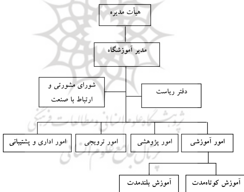
نمودار 2 ساختار پیشنهادی مراکز و آموزشگاههای کارآفرینی

براساس مطالعات میدانی تحقیق و تجزیه و تحلیل مصاحبه‌های به‌عمل آمده با رؤسا و معاونین مراکز فنی - تخصصی و مدیریتی و سازمانهای سیاستگذار و پشتیبانی کننده آنها و بازنگری، جرح و تعدیل و اعمال تغییرات و اصلاحات لازم، ساختار سازمانی مراکز و آموزشگاههای کارآفرینی و اهداف و شرح وظایف بخشهای آن به‌صورت زیر طراحی و تدوین گردید: