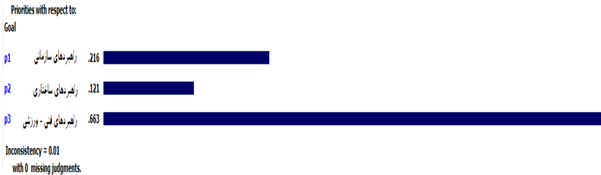
شکل ۴. خروجی نرم‌افزار Expert Choice برای راهکارهای سرآمدی فدراسیون ملی تنیس روی میز در سطح بین‌المللی