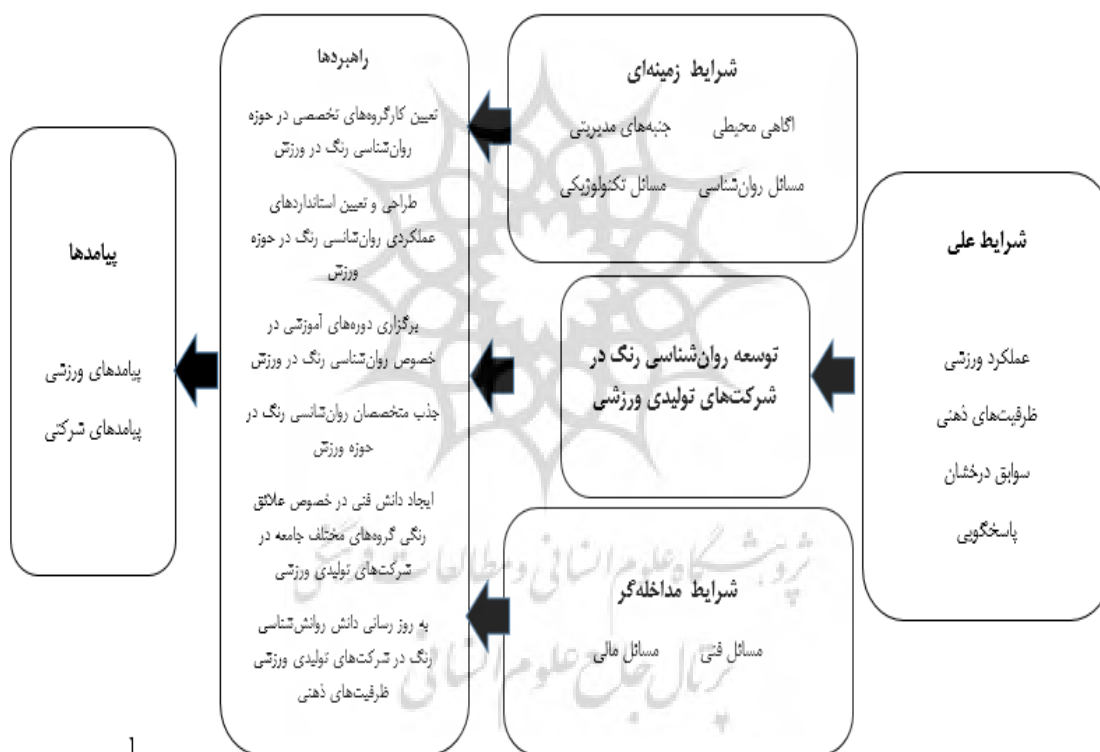
شکل ۱- مدل پارادایمی تحقیق

پس از کدگذاری محوری، کدهای استخراج شده در بخش کدگذاری باز به صورت مناسب مقوله‌بندی شد. شکل شماره دو، مدل پژوهش و