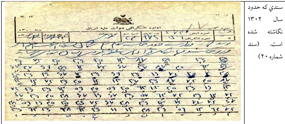
سندی که حدود سال ۱۳۰۲ نگاشته شده است. (سند شماره ۲۰)

یکی از اقداماتی که در دوره پهلوی اول رایج بود درج عنوان محرمانه روی پاکت‌های ارسالی به نمایندگان کشور در دول خارجه بود. رویه‌ای که تا سال ۱۳۱۷ جریان داشت و با این اقدام عملاً دسترسی جاسوس‌های خارجی به این نامه‌ها تسهیل می‌شد. اهمیت این اشتباه زمانی درک می‌شود که توجه شود روس‌ها در باز کردن نامه‌های مهر و موم شده از چنان تبحری برخوردار بودند که حتی از فحوی نامه‌نگاری انگلیسی‌ها نیز آگاه بودند و از محتویات نامه عکس تهیه می‌کردند. بنابراین درج عنوان محرمانه روی نامه‌ها عملاً آنها را در دسترس آسان سرویس‌های اطلاعاتی خارجی قرار می‌داد. این رویه ادامه داشت تا اینکه سال ۱۳۱۷ وزیر خارجه طی نامه‌ای به وزارت جنگ توصیه کرد بر روی پاکت نامه‌ها از عنوان محرمانه یا خیلی محرمانه استفاده نشود (سند شماره ۳۰).