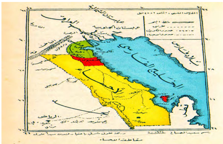
نقشه شماره ۱. نقشه نگار سعید الصباغ سال ۱۹۲۴ میلادی (الریحانی، ۱۹۶۷: ۲۰۹/۲)

سند شماره ۵. نامه کلنل آرتور پریسکوت ترور (A.P.Trevor) مقیم سیاسی بریتانیا در خلیج فارس به شیخ سلطان بن زاید (عبدالغنی، ۲۰۰۴: ۲۲۱)