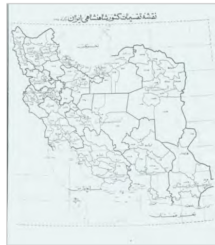
تصویر شماره ۴. نقشه تقسیمات سیاسی کشور شاهنشاهی ایران (وزارت کشور، ۱۳۳۹: ب)