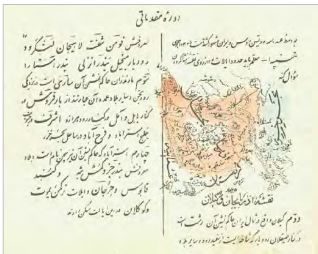
تصویر شماره ۲. نقشه آذربایجان و گیلان (مهندس الملک، ۱۳۳۱ق: ۱۹)