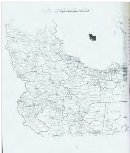
تصویر شماره ۵. قسمت دوم دهستان‌های ایران شمال غرب (وزارت کشور، ۱۳۳۹: د)