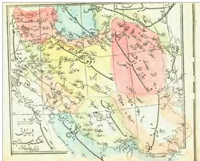
تصویر شماره ۱. نقشه سیاسی ایران (مهندس الملک، ۱۳۳۱ق: ۱۸)