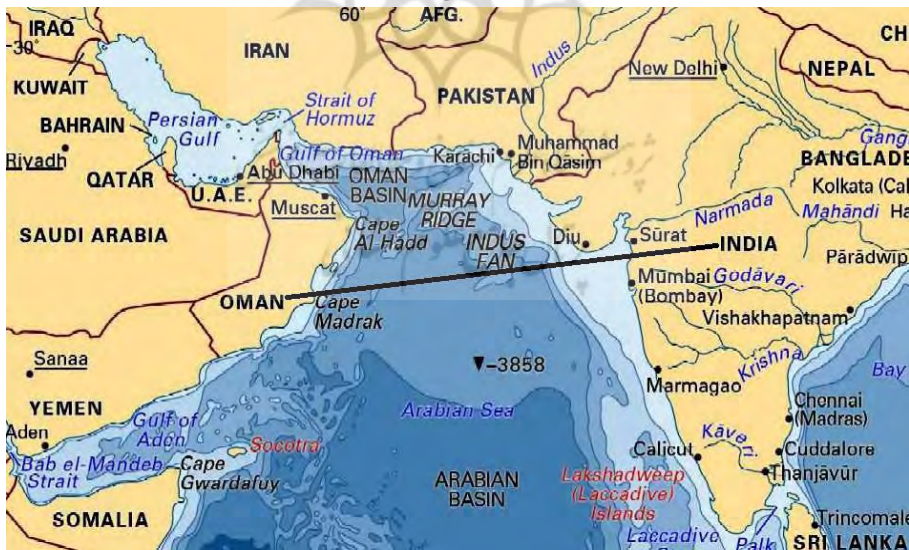
نقشه شماره ۱: موقعیت جغرافیایی هند و عمان نسبت به یکدیگر

حال باتوجه به موارد گفته شده، پرسش اصلی در این مقاله این است که راهبرد دیپلماسی اقتصادی هند در عمان دارای چه عناصری و تبیین کننده چه اهدافی می باشد؟ روش پژوهش استفاده شده در این مقاله کیفی و با رویکرد توصیفی - تحلیلی است. بدین معنا که پژوهش توصیفی، جامعه، شرایط و پدیده‌ها را به طور صحیح و سیستماتیک توصیف می کند. این روش پژوهش به پرسش‌هایی که شامل چه چیزی، چه زمانی، کجا، و چگونه هستند، پاسخ می دهد. در طراحی پژوهش توصیفی برای بررسی متغیرها انواع روش‌های کمی و کیفی به کار گرفته می شود. برخلاف پژوهش آزمایشی، پژوهشگر متغیرها را کنترل یا دستکاری نمی کند، ولی آنها را مورد مشاهده و آزمون قرار می دهد (سید امامی، ۱۳۹۰: ۷۳). همچنین شایان ذکر است که مطالب این پژوهش از طریق فیش برداری از ابزار گردآوری اطلاعات همچون کتاب، مقاله، اینترنت و... جمع آوری شده است. همچنین ابزار گردآوری اطلاعات در این مقاله، کتاب‌ها، مقالات، گزارش‌ها، پایگاه‌های اینترنتی و... می باشد. این پژوهش از آن رو اهمیت دارد که در قالب پژوهش‌های انجام شده در حوزه مطالعات منطقه‌ای در ایران، تا کنون به آن پرداخته نشده است و از آن رو ضرورت دارد تا با تبیین و شناخت رویکردهای هند به عنوان یک بازیگر مهم در نظم نوین بین‌المللی، سیاست‌گذاری‌های ایران در حوزه دیپلماسی اقتصادی و نیز همکاری‌های منطقه‌ای ارتقاء یابد.