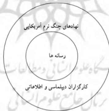
شکل ۱. تاکتیک برجسته‌سازی در مذاکرات هسته‌ای

با توجه به پژوهش موردنظر، در مذاکرات هسته‌ای، طرفین مذاکره بارها در جنگ رسانه‌ای خود با برجسته‌سازی اقدامات و تحرکات، پیشبرد اهداف را فراهم می‌ساختند. براساس این نظریه عوامل اجرا کننده عملیات روانی بر عهده دو گروه کلی رسانه‌ها و بخش دیپلماسی، اطلاعاتی و نهادهای جنگ نرم آمریکا بود. در واقع این دو عوامل نقش عوامل برون سازمانی و درون سازمانی نظریه برجسته‌سازی را ایفا کرده‌اند. رمز موفقیت این دو عامل در همپوشانی و تعامل راهبردی با هم است. ادعایی که در ادامه با تحلیل محتوایی عملکرد کارگزاران جنگ نرم آمریکا با بهره‌گیری از سازوکارهای عملیات روانی مورد ارزیابی قرار گرفته است. در یک جمع‌بندی کلی از بحث نظری این مقاله می‌توان گفت ساخت آگاهی عمومی مرتبط با موضوعات بازیگران از محیط بین‌الملل و رفتار دیگران متأثر از تجربه و زمینه تاریخی آن‌ها نسبت به «خود» از «دیگران» است. در چنین شرایطی، مسئله‌سازی، دوستی و دشمنی را خود دولت‌ها بنا بر محیط ذهنی خویش که انباشته از تجربیات زمینه‌مند است، تعریف می‌کنند. مطابق با این طرز فکر وجود یک سلاح در دست یک دوست، متفاوت از وجود همان سلاح در دست دشمن است. آمریکا با استفاده از ظرفیت‌های داخلی و بین‌الملل خود نسبت به ایجاد ساخت عمومی موضوعات برای مواجهه یا فعالیت‌های هسته‌ای ایران و به‌ویژه مذاکرات هسته‌ای اقدام کرده است.