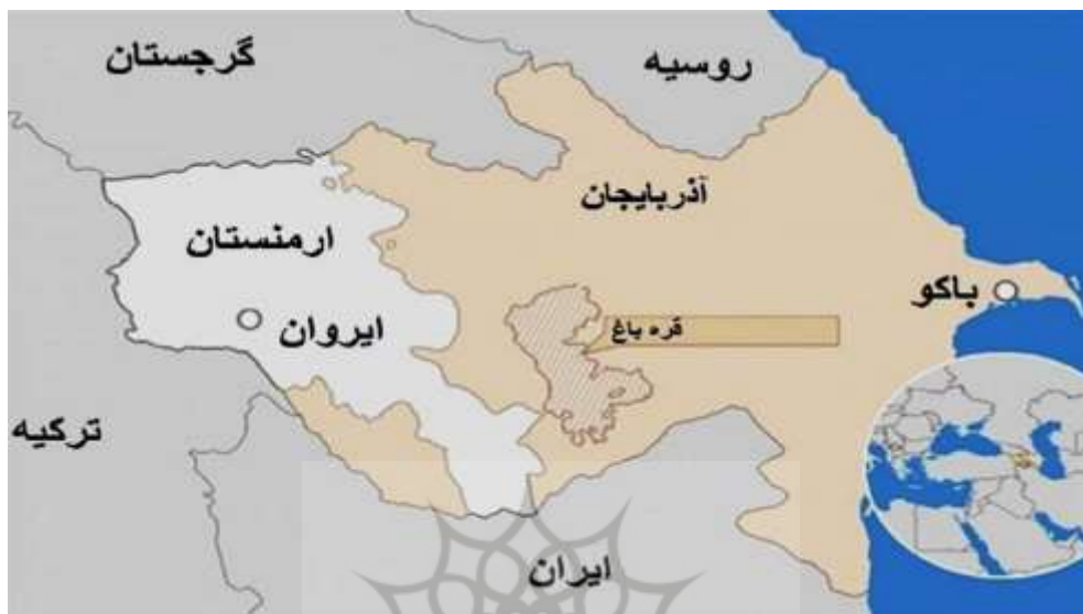
نقشه (۱): موقعیت جغرافیایی منطقه قفقاز جنوبی

ب: قفقاز شمالی یا ماورای قفقاز شامل جمهوری‌های خودمختار تحت حاکمیت فدراسیون روسیه به ترتیب از شرق به غرب؛ داغستان، چچن، اینگوش اوستیای، شمالی کارباردا - بالکار قاراچای، چرکس و آدیگه (افشردی، ۱۳۸۱: ۳۷).