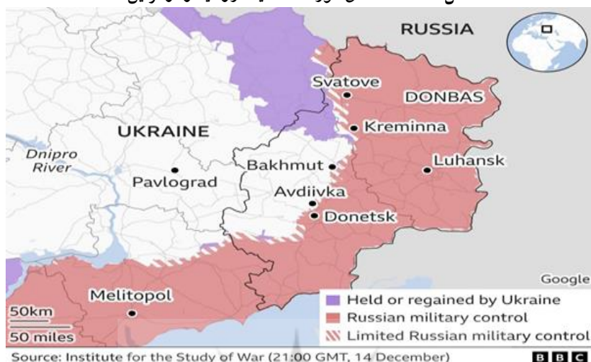
شکل ۱: نقشه مناطق مورد ادعا میان روسیه و اوکراین