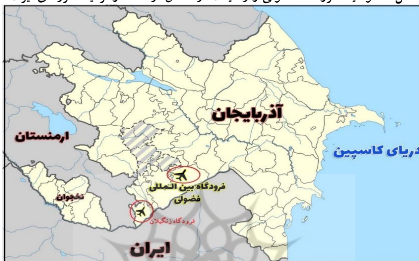
شکل ۳: موقعیت فرودگاه فضولی و زنگلان در مناطق آزادشده و نزدیک مرزهای ایران

زنگلان در سال ۲۰۲۲ کامل شد. فرودگاه لاجین نیز در بهار ۲۰۲۴ تکمیل خواهد شد (Nakanishi, 2023: 33).