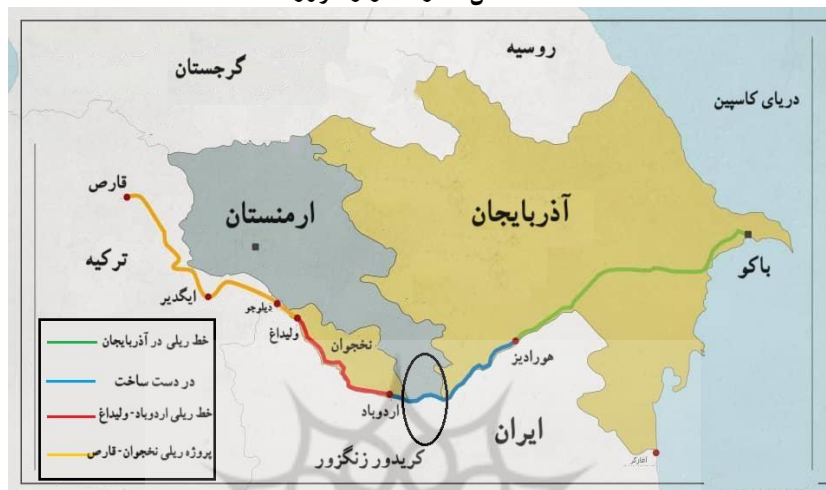
شکل ۴: راه‌گذر زنگزور

روندهای ژئوپلیتیکی در جنگ دوم قره‌باغ است که می‌تواند پیامدهای ژئوپلیتیکی نیز در آینده به‌همراه داشته باشد.