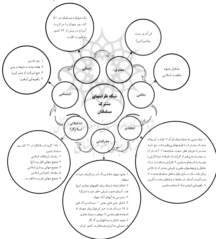
نمودار شماره ۲: پیوندهای شبکه‌ای ظرفیت‌ها با هدف انسجام مسلمانان

مسلمان‌نشین بی‌معنی است و باید همگام با تبدیل حکومت‌های ملت‌گرا به حکومت اسلامی، مرزها به‌صورت «باز و آزاد» در آید. (صدیقی / ۱۳۷۵: ۱۲۴) بر این مبنا بدیهی است که با شناسایی ظرفیت‌ها مختلف و ایجاد انسجام به‌شکل شبکه‌ای از ظرفیت‌ها مسیر و زمینه تشکیل امت مسلمان و از سوی دیگر هم‌افزایی که نتیجه انسجام بخشی است به تدریج به منصفه عینیت راه پیدا خواهد کرد. عناوین ظرفیت‌های مقدور مسلمانان در منطقه خاورمیانه و دیگر کشورهای مسلمان در پژوهش انجام گرفته توسط قوی بر مبنای دیدگاه امام خمینی (ره)، رهبری نظام و عملکرد جمهوری اسلامی ایران را می‌توانیم در نمودار شماره ۲ مشاهده کنیم.