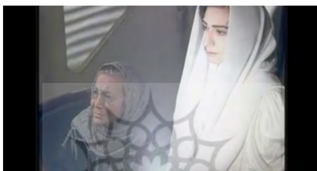
(تصویر شماره ۱۲)

با آینه‌ای که نور را منعکس می‌کند وارد شدند صورت همه در امتداد نور درخشید، می‌توان آن را مشاهده نمود. (تصویر شماره ۱۱) برای نشان دادن استعاره «شادی، نور است» یا «نور یعنی زندگی» در این فیلم می‌توان در بخشی که مهتاب (برگشته از دنیای مردگان) آینه را به سمت عروس می‌گیرد و نور آن را به سوی او می‌تاباند، دید. در اینجا شخصیت‌ها و صحنه را غرق در نور بارنگ‌های گرم می‌بینیم و آنچه به ذهن تداعی می‌شود شادی و گرمای عشق است. کارگردان در اینجا با بهره‌گیری از عنصر آینه و نور توانسته است معانی پیچیده، عمیق و حتی ناگفتنی را به شکلی استعاری بیان کند. (تصویر شماره ۱۲)