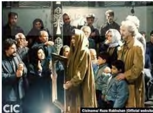
(تصویر شماره ۸)

در فرهنگ ایرانی آینه نشانه هر چیز خوب، روشنی، پاکی، فرهنگ، امید، سازندگی، باروری، شادی، زندگی و غیره است. نماد هر چیز پاک، صافی، نور، صداقت. نماد یک فرهنگ. نماد ارزش‌های فرهنگی ایرانی. رمز تجلی است که از خود نوری ندارد، بلکه نور مطلق را باز می‌تاباند. نماد زایش و تکرار است. در انگاره‌های استعاره‌ای آنچه آینه را شایسته معنای سرزندگی و بقا ساخته همین نور است. نوری که منشأ آن نورالانوار است و از ازل، در نهاد انسان به ودیعت نهاده شده است. این آمیزه آسمانی را باید سرآغاز آینه‌واری انسان و جهان دانست. در حقیقت استعاره‌هایی که با آینه ساخته می‌شود یکی از تصاویر ثابت و معین فرهنگ ایرانی و ادبیات فارسی است که به قوه خیال و آگاهی هنری ارتباط دارد.