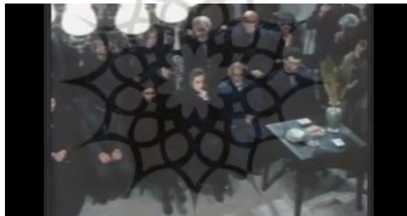
(تصویر شماره ۵)

در مجلس عزا بر شش صندلی خالی تور سیاه کشیده شده که نشانه‌ای از مرگ کسانی است که دیگر در این دنیا حضور ندارند، همچنان که روی آن صندلی نیستند و به‌جایشان تور سیاهی کشیده شده. این صحنه صامت بدون اینکه با دیالوگی همراه باشد نشان از استعاره مفهومی مرگ و ناپودی و عدم حضور است. (تصویر شماره ۵)