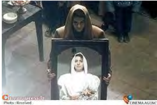
(تصویر شماره ۹)

در فیلم مسافران آینه و مفاهیم مرتبط با آن یک عنصر کانونی است. (تصاویر ۸ و ۹) آینه موروثی که قرار است مهتاب آن را برای خواهر نوعروسش بیاورد، استعاره و نشانه‌ای از تداوم و بخت در خانه معارفی‌ها است، به طوری که در صحنه پایانی اشخاصی که مرده‌اند می‌آیند و آینه را واگذار می‌کنند. آن‌ها برای ستایش زندگی می‌آیند و آن را به نسل نو، شادباش می‌گویند. در روایت آشکارسازی که با مرگ خاتمه می‌یابد یک عنصر بسیار مهم گم‌شده (آینه) وجود دارد در اینجا نوعی از استعاره از نوع مقوله سازی دیده می‌شود که واقعیت خارجی ندارد و آنچه ما به عنوان واقعیت می‌بینیم، تجسم اندیشه انسان‌ها است. به این معنا که آینه را در مفهوم زندگی، شادی، امید و... بر می‌سازد.