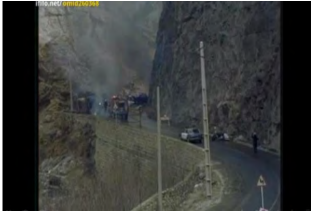
(تصویر شماره ۷)