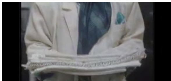
(تصویر شماره ۱)