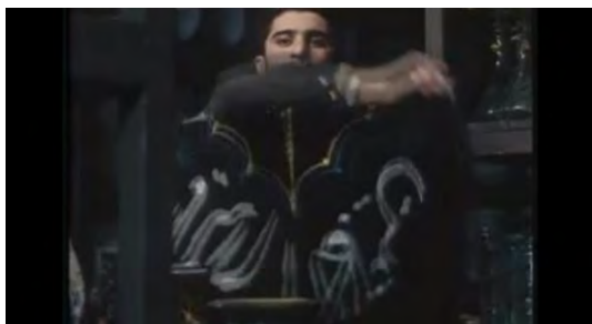
(تصویر شماره ۳)

«صورتی‌ها رو حذف کن... زردا، طلاییا... جابجایی شمعدان‌های طلایی و روکش‌های سفیدرنگ و آینه قاب طلای فرشته‌ای و سایر اقلام عروسی با پرده‌های صوراسرافیل، رومیزی ترمه، زیرسیگاری با رقم یا صاحب صبر و سایر اقلام عزا... زیرسیگاری‌ها با رقم یا صاحب صبر، کتیبه‌ها با رقم یا کرام‌الکاتبین...»