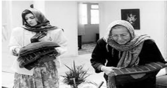
(تصویر شماره ۴)

در مجلس عزا بر شش صندلی خالی تور سیاه کشیده شده که نشانه‌ای از مرگ کسانی است که دیگر در این دنیا حضور ندارند، همچنان که روی آن صندلی نیستند و به‌جایشان تور سیاهی کشیده شده. این صحنه صامت بدون اینکه با دیالوگی همراه باشد نشان از استعاره مفهومی مرگ و ناپودی و عدم حضور است. (تصویر شماره ۵)