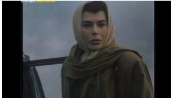
(تصویر شماره ۱۳)

«ما میریم تهران. برای عروس خواهر کوچیکترم. ما به تهران نمی‌رسیم. ما همگی می‌میریم.» (تصویر شماره ۱۳)