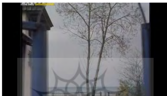
(تصویر شماره ۲)

در ادامه فیلم نیز ماهو با شنیدن خبر مرگ برادرش شروع به تعویض وسایل صحنه می‌کند، (تصویر شماره ۳ و ۲) این مسئله در سراسر فیلم هم به‌وسیله میزانشن ها و هم دیالوگ‌ها نشان داده می‌شود: