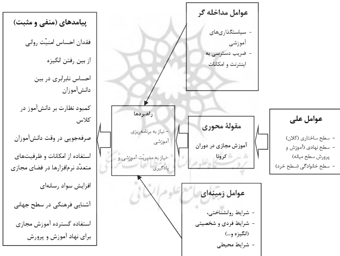
شکل ۱- مدل پارادایمی تحقیق

بر مبنای کدگذاری‌های انتخابی (گزینشی) ارائه شده در بخش پیشین، در خصوص شرایط علی، شرایط زمینه‌ای، شرایط مداخله‌گر، پدیده‌محوری، پیامدها و راهبردها، حال می‌توان مدل برآوردی پژوهش حاضر را ترسیم نمود. لازم به توضیح است که برخی از عناوینی که در مدل آمده است، در توضیحات یافته‌ها به‌خاطر جلوگیری از اطناب کلام در شکل موسع به آن‌ها پرداخته نشده است، ولی سعی شده که تمامی اجزا به‌صورت شماتیک در قالب مدل پارادایمی پیش‌رو آورده شود.