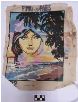
تصویر ۳: کوبلن (cm ۳۰*۲۵)، اثر شهید بهرام سلیمانی.

جالب توجه است آثاری چون کوبلن دوزی‌ها با پرتره زن که برای شماره دوزی انتخاب می‌شده؛ به نوعی عشق و علاقه فردی رزمنده به خانواده را نشان می‌دهد؛ که در حواشی برخی از این آثار نوشته‌هایی با مضامین دینی و عناوین مناطق جنگی نیز آمده است. برای نگارنده موضوع جالب توجه این بود که اثرهای این‌چنینی چون تصویر شماره ۳ با توجه به لکه‌های خونی که در آن قابل مشاهده است؛ بیانگر این نکته است که رزمنده در زمان و مکان جنگ در فرصت‌های استراحت خود در سنگر به این هنر می‌پرداخته است.