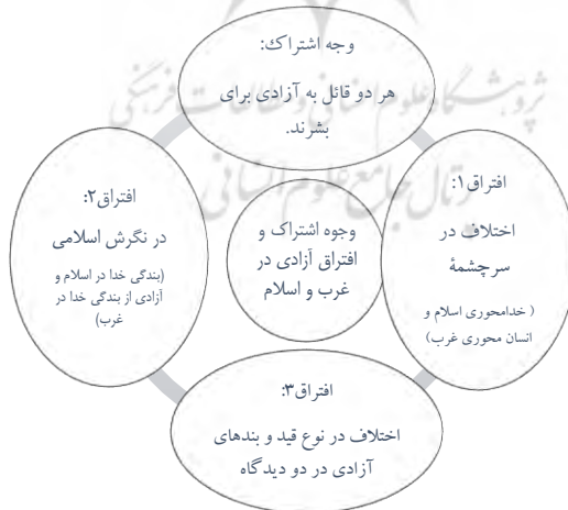
نمودار ۴. وجه اشتراک و افتراق آزادی در اسلام و غرب

- وجه افتراق سوم این است که در دین اسلام آزادی فقط رهایی از قیدوبندهای خارج از وجود انسان و رفع موانعی بیرونی او نیست، بلکه رفع موانع درونی هم بزرگ‌ترین آزادی‌هاست؛ اما آزادی غربی فقط به رفع قیدوبندهای خارج از وجود انسان می‌پردازد و با این عمل، در حقیقت زمینه بردگی انسان‌ها را با دامن زدن به تمایلات و هوس‌ها و آزاد گذاشتن آن‌ها فراهم کرده، راه ضلالت و بدبختی آن‌ها را هموار می‌سازد.