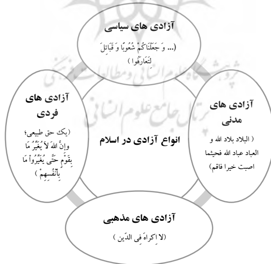
نمودار ۲. انواع آزادی در اسلام