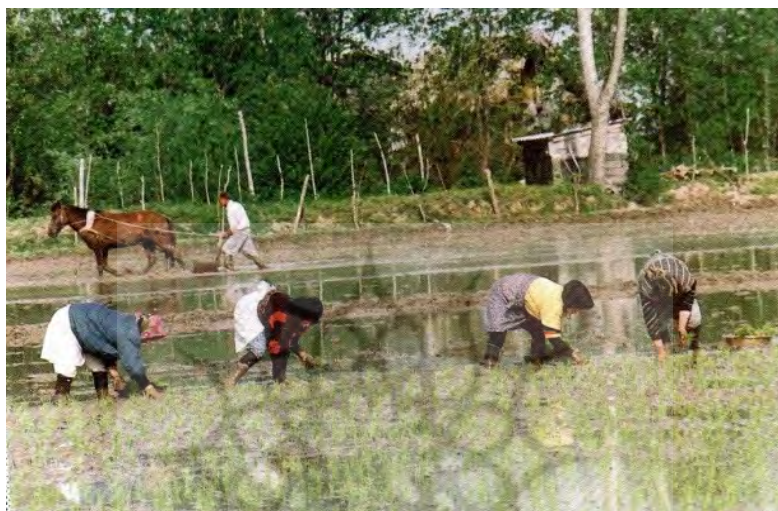
عکس ۱- زنان گیلانی در حال نشاء در مزارع برنج منطقه لشت نشاء (عباسی، ۱۳۸۱: ۲۱۷)

در این بخش به گوشه‌ای از ویژگی‌های جمع‌گرایانه و مشارکتی و تعاون و همیاری سنتی در میان زنان گیلانی اشاره خواهد شد.