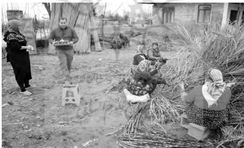
عکس ۴- بی‌نام، گزارش برداشت و پخت نیشکر در صومعه‌سرا، ۱۰ بهمن ۱۳۹۲، اقتباس از:

یاوری در دروی نیشکر در روستاهای لنگرود و صومعه‌سرا، از آیین‌های سنتی و مردمی منطقه است که زنان و مردان روستا در اقدامی مشترک در آن شرکت دارند. نه تنها دروی نیشکر که استخراج عصاره و پختن آن هم با تعاون انجام می‌گیرد، چرا که اگر کار به تعویق بیفتد. نیشکر خشک و کم آب می‌شود و زحمات کشاورزان بر باد می‌رود.