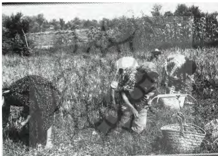
عکس ۲- یآوری زنان در برداشت حبوبات و صیفی‌جات باغ‌های لشت نشاء (عباسی، ۱۳۸۱: ۲۳۰)

یا محدوده‌های دایره‌ای را برای کاشت تخم خیار و کدو و هندوانه و خربزه آماده کرده و تخم ترب و شاهی می‌افشانند. در هر حال پیش از آن زمین شخم زده با کج ییل ریز و هموار و گیاهان نامطلوب پاک می‌شود، کاری که به صورت گروهی و با کمک دیگران انجام می‌گردد. این مراسم در مناطقی است که به صورت سنتی اراضی را کشت می‌کنند، در جاهایی که از تراکتور و ماشین‌های تخم برای تولید استفاده می‌شود و باغداری مکانیزه شده از این سنت خبری نیست.