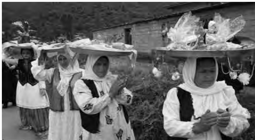
عکس ۵- بی نام، گزارش برداشت و بخت نیشکر در صومعه سرا، ۱۰ بهمن ۱۳۹۲