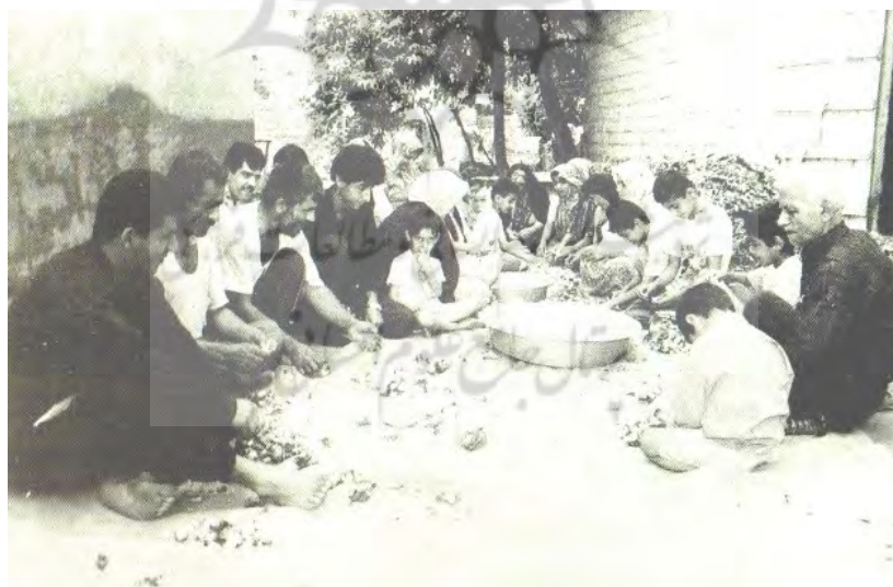
عکس ۳- پیله‌چینی یاور، لشت نشاء گیلان (عباسی، ۱۳۸۱:۲۲۸)

صاحب تلمبار نوغان را در اطراف محل پرورش نوغان یا داخل حیاط خانه‌اش زیر سایهٔ درختان حصیر یا زیرانداز پهن می‌کند. پیرمردان و جوانان و کودکان یک‌طرف و زنان و دختران در طرف دیگر می‌نشینند. یاوران پس از «مبارک باد» گفتن به صاحب تلمبار شروع به چیدن و تمیز کردن پیله می‌نمایند. در طول انجام کار صاحب تلمبار از یاوران با چایی و انواع خوردنی پذیرایی می‌کند.