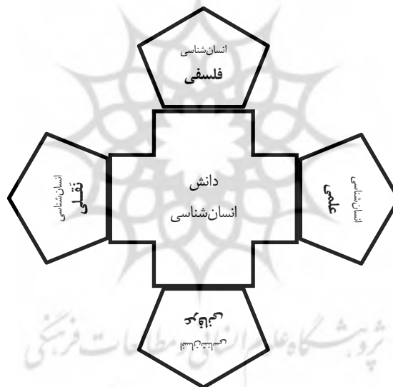
شکل ۱. شاخه‌های اصلی دانش انسان‌شناسی

براساس این به چهار شاخه اصلی انسان‌شناسی علمی، انسان‌شناسی عرفانی، انسان‌شناسی فلسفی، و انسان‌شناسی نقلی رسیده می‌شود (شکل ۱). گفتنی است در بسیاری از طبقه‌بندی‌های دانش انسان‌شناسی به ویژه در منابع فارسی و در بین اندیشمندان ایرانی و به‌طور عمده، دینی، انسان‌شناسی را به چهار قسم علمی، عرفانی، فلسفی، و دینی تقسیم‌بندی کرده‌اند که این نوع تقسیم‌بندی به دو دلیل نادرست است: نخست، انتخاب عنوان «دینی»، عدول از مبنای اولیه تقسیم (یعنی معیار روش‌شناختی) است و دوم، «انسان‌شناسی دینی» عنوان عامی ناظر به موضوع (و نه روش) پژوهش انسان‌شناسی است که براساس مورد - همان‌گونه که در ادامه مقاله نشان داده خواهد شد - ممکن است در ذیل هر چهار قسم علمی، فلسفی، عرفانی و نقلی بگنجد.