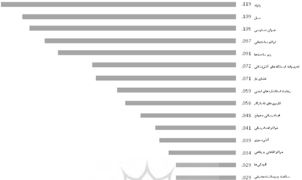
تصویر ۵. مقایسه شاخص‌های کالبدی- محیطی مؤثر در کاهش میزان آسیب‌پذیری مجتمع گردشگری جهاد دانشگاهی.