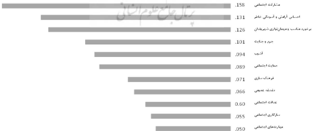
تصویر ۴. مقایسه شاخص‌های اجتماعی مؤثر در کاهش میزان آسیب‌پذیری مجتمع گردشگری جهاد دانشگاهی.

محیط و کالبد هر منطقه می‌تواند تأثیر به‌سزایی در بحث مدیریت بحران در مجتمع‌های گردشگری داشته باشد. به‌طوری که دوری از مراکز سیل و زلزله، نحوه دسترسی و امداد رسانی، از جمله شاخص‌های تأثیرگذار در مدیریت بحران به‌شمار می‌روند. از آنجایی که مخاطرات محیطی یکی از مهمترین عوامل به‌وجود آورنده بحران در هر محیط است، براساس نظر افراد پاسخگو، زلزله در میان شاخص‌های کالبدی - محیطی بررسی‌شده در مجتمع گردشگری جهاد دانشگاهی، بالاترین اهمیت را دارد.