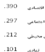
تصویر ۲. مقایسه مؤلفه‌های مؤثر در کاهش میزان آسیب‌پذیری مجتمع گردشگری جهاد دانشگاهی. مأخذ: نگارندگان.