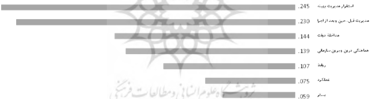
تصویر ۶. مقایسه شاخص‌های نهادی مؤثر در کاهش میزان آسیب‌پذیری مجتمع گردشگری جهاد دانشگاهی.

خبرگان، استفاده شده است. بعد از اخذ نظرات خبرگان، هر یک از شاخص‌ها به صورت میانگین هندسی حاصل از نظرات کارشناسان استفاده شده و این میانگین هندسی به سمت بالا گرد شده است. در این بخش، ماتریس گزینه‌ها و شاخص‌ها تنظیم می‌شود که در آن ارزش هر گزینه نسبت به شاخص متناظر جایگذاری می‌شود که به این منظور نظریه کارشناسی (خبرگان) متعددی استفاده و سپس از این نظرات میانگین هندسی گرفته و به سمت بالا گرد شده است و اولویت‌بندی و تعیین ارزش هر کدام از شاخص‌ها با مؤلفه‌های اجتماعی، اقتصادی، کالبدی- محیطی و نهادی استفاده شده است.