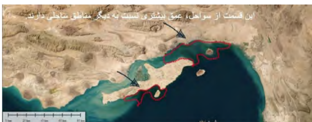
تصویر ۴. نمایش عمق دریا در لبه ساحل استان هرمزگان.

۲۱) و حمله استعماری دولت های استعماری به بندرعباس (قائم مقامی، ۱۳۵۴، ۱۹۶). در مناطقی که دارای شرایط رشد گونه های گیاهی چه از نظر خاک و چه از نظر آب مناسب بوده است، زمینه توسعه شهرهای جنوبی فراهم شده و منظر نرم-سخت شکل گرفته است، مانند بندر خمیر، لنگه، کنگ و.. که بندر و شهر در یک زون بندی قرار دارند و توأم باهم کار می کنند، در حالی که، در بنداری مثل بندر رجایی، حقانی، بندرعباس، شهر و بندر در دو منطقه کاملاً جدا از هم دیگر قرار دارند. «ساختار فضایی سرزمین ایران در طول دو دهه اخیر، برمبنای ساختار منظوم های قطب محور شکل گرفته است» (داداش پور و آراسته، ۱۳۹۷، ۱۴). در بندرعباس شهر، اقتصاد، مردم و قدرت ارتباط متقابل دارند. بندرعباس نزدیک به دریای عمان و و تنگه هرمز و دارای جایگاه امنیتی است. در جزیره قشم، شهر و روستاها تنها در بخشی که دارای خاک قابل کشت بوده، تشکیل شده و بقیه مناطق که خاک نامناسب کشت دارند، به عنوان زیست بوم های دست نخورده و خالی از دخالت های بشری است. در شهر قشم، تراکم گیاهان خودرو نسبت به نقاط دیگر جزایر بیشتر است. در واقع، از جمله دلایل عدم توسعه بندار و شهرها در جزیره هرمز و قشم وجود آهک و خاک نامناسب و شوری آب است. جایی که درصد آهک کم می شود، شهرها شکل می گیرند (برگرفته از تحلیل نقش زمین شناسی قشم)، (ضارعزاده و رضایی، ۱۳۹۰، ۱۲۴). بنابراین مداخله انسانی افزایش پیدا می کند و جنس منظر به سمت سخت شدن می رود. در نتیجه، برای درک و پی بردن به دلایل شکل گیری مناظر لبه های ساحلی، باید به طبیعت و ویژگی های منطقه توجه کرد.