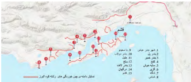
تصویر ۱. نمایش دامنه چین خوردگی های رشته کوه البرز در استان هرمزگان و محل پیدایش تعدادی از شهرها، روستاها و بندار.