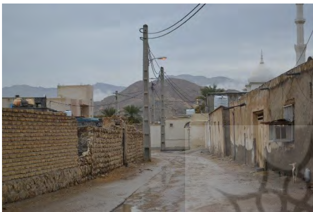
تصویر ۲. نمایش کوه در کوچه های بندر خمیر. عکس: فهیمه حسینی فر، ۱۴۰۱.