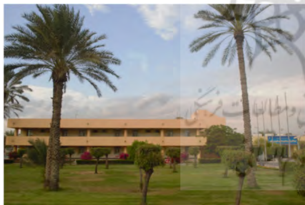
تصویر ۳. دید به کوه در بندر رجایی. عکس: فهیمه حسینی فر، ۱۴۰۱.