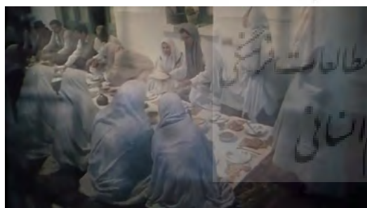
تصاویر ۱۷ و ۱۸. فیلم درخت گلابی، فیلمبردار: محمود کلاری، تدوینگر: مصطفی خرقةپوش. مأخذ: (تصاویر برگرفته شده از فیلم)

میم که در آن خود نظاره‌گر میم زیر نور روز بود، در شبی در حال قدم‌زدن در باغ است و به سمت ایوان خانه باغ می‌رود. در این خاطره برش‌ها اغلب برش پرشی هستند، نماها بر روی هم درآمیزی می‌شوند و حتی در نماهایی از یک سوژه، تداوم وجود ندارد زیرا مخاطب با کنشی که در نمای پیشین پایان یافته است، در نمای بعدی نیز روبه‌رو می‌شود. گویی حافظه، به واسطه‌ی مرور مجدد حرکتی، سعی بر یادآوری باقی خاطره دارد (تصاویر ۱۷-۱۸). در صحنه‌های پایانی فیلم نیز پیوند بین زمان حال و گذشته در مکانی یکسان به واسطه‌ی درآمیزی صورت می‌پذیرد. شروع خاطره با نمایی از درخت گلابی در زمان حال است که به نمایی از مادر بزرگ و پدر محمود در کنار