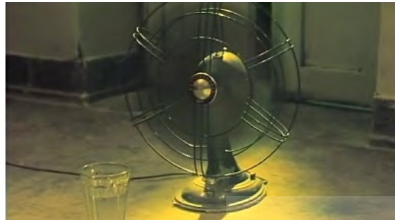
تصاویر ۱۹ و ۲۰. فیلم درخت گلابی، فیلمبردار: محمود کلاری، تدوینگر: مصطفی خرقة‌پوش. مأخذ: (تصاویر برگرفته شده از فیلم)

شد این گونه به تصویر کشیده شده‌اند، و پراندن مگس توسط میم، می‌تواند خاطراتی از زندگی خویش را به یاد آورد. پس در این صحنه مخاطب تنها نظاره‌گر خاطرات محمود نیست بلکه خاطرات خودش را نیز به یاد می‌آورد. پس این خاطره کارکردی نوستالژیک را در فیلم داراست (تصویر ۲۰).