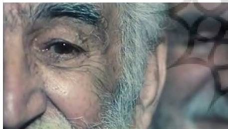
تصاویر ۱۱ و ۱۲. فیلم درخت گلابی، فیلمبردار: محمود کلاری، تدوینگر: مصطفی خرقةپوش.