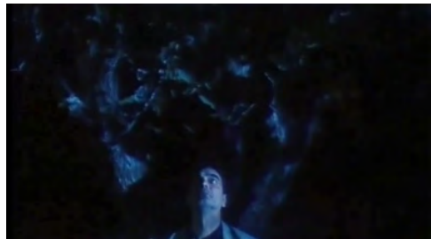
تصاویر ۹ و ۱۰. فیلم درخت گلابی، فیلمبردار: محمود کلاری، تدوینگر: مصطفی خرقةپوش.