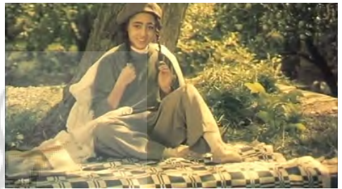
تصاویر ۶ تا ۸. فیلم درخت گلابی، فیلمبردار: محمود کلاری، تدوینگر: مصطفی خرقةپوش. مأخذ: (تصاویر برگرفته شده از فیلم)

پیوند می‌خورد و یا در ادامه با حرکت عمودی رو به بالای دوربین بر محور ثابت (تیلت آپ) روی درخت گلابی در زمان حال، مخاطب شاهد برش زمانی از حال به گذشته است که میم در نمای دوم در بالای درخت گلابی است. همچنین این مورد در نماهای انتهایی فیلم نیز دیده می‌شود؛ زمانی که محمود سرش را بالا می‌برد تا درخت را نگاه کند، دوربین با حرکت سر محمود حرکت عمودی رو به بالا بر محور ثابت (تیلت آپ) دارد و به نمایی از محمود نوجوان برش می‌خورد که از درخت بالا می‌آورد و در بالای درخت نگاهش به تار عنکبوتی است (تصاویر ۹-۱۰).