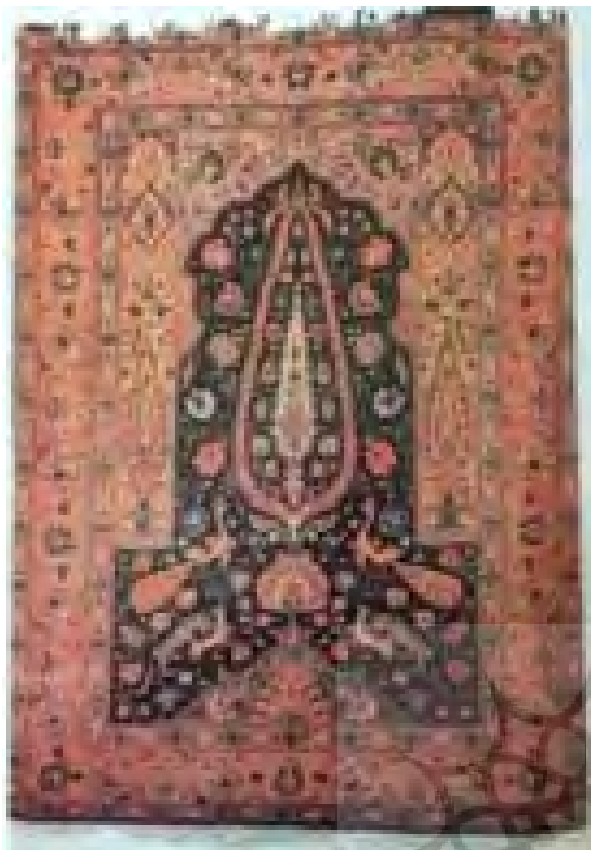
تصویر ۱۱- (بالا سوم از راست) نقش درخت ویسبوییش محرابی، از طرح‌های اولیه کرمان محرابی، ۱۲۵۰ ه.ش.