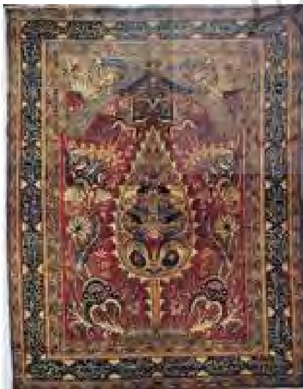
تصویر ۱۲- (بالا چهارم از راست) درخت ویسبوییش خصوصی. مأخذ: (بصام، ۱۳۸۳، ۲۲)