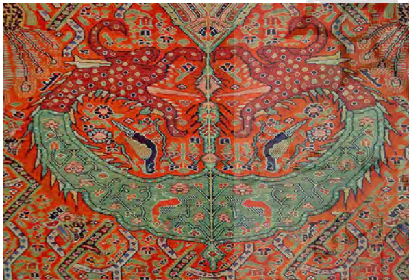
تصویر ۲- نیمه پایین پارچه مذکور، ریشه درخت اسطوره‌ای و حیوانات در برگرفته‌اش.

در حال نیش زدن به بن درخت. شایان توجه است نگارندگان در خوانشی دیگر از تصویر معتقدند بدن اژدها در واقع دریایی به رنگ سبز-آبی است که گویی ریشه درخت از درون آن روییده است. ۱۳ در این بخش گل و غنچه‌های چندپدر و دوپرنده نیز دیده می‌شود (تصویر ۳).