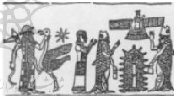
تصویر ۷- مهر آشوری.

در ادامه داستان به راه‌هایی در پیش روی گیلگمش اشاره می‌شود که به روشنی منتهی به کوه سرو و مفر خدایان و ایرنینی است. سپس به زیبایی درخت‌ها اشاره کرده و از برگ‌ها و میوه‌هایش تعریف می‌کند. همچنین با استناد به شواهد باستانی درخت زندگی در تمامی فرهنگ‌های هند و اروپایی از مرکزیتی مذهبی برخوردار بوده و این مسئله ریشه در فرهنگ نوسنگی داشته است. به‌طوری‌که در باب نیایش درخت زندگی در عهد عتیق آمده است که میکائیل به خونخ در مورد مراسم نیایش درختی توضیح می‌دهد میوه‌اش زندگی ابدی می‌بخشد. وجود متون میخی از هیتی‌ها در ۲۰ ق.م و ۱۳ ق.م مبین قدمت این نیایش است. در مهر (تصویر ۷) خدای آشور در حال پرواز بر فراز درخت زندگی ای است که دوراهب با چهره مبدل ماهی از درخت محافظت می‌کنند. این ماهی‌ها نماد زندگی و رستاخیزند (Ibid., 370). در اوپانی‌شاد نیز درخت زندگی ای با نام آشوتاً ۳۷ هم‌دوره با مهرهای آشوری چنین آمده است: این درخت تخم‌همه‌چیز (همه‌چیز تخمه) است و شیرای که از آن به دست می‌آید مانند سوما آب حیات است. در مهرهای بابلی آشوری در حاشیه‌های تصویر مارهایی که نیروی الهی و باروری هستند دیده می‌شود، در اصل مار متعلق به همان سیستم فکری ماهی است. شباهت واژه مارهایی و مار در بسیاری از فرهنگ‌های هند و اروپایی گواه این مطلب است (Ibid., 380-389). نگارندگان معتقدند که در مجموع روایات منسوب به درخت زندگی و نگهبانانش اژدها به‌مثابه مار و مار به‌مثابه ماهی تصویر شده است.