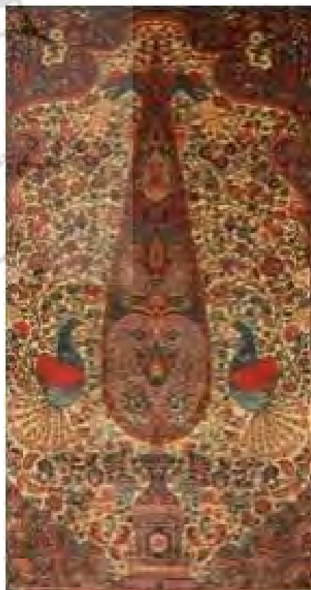
تصویر ۱۰- متن فرش.