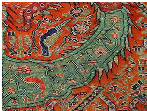
تصویر ۳- پزندگان و گل‌ها و غنچه‌ها.

هم‌قرار گرفته و یا پراکنده هستند. هم‌چنین در رأس درخت یک طاووس نشسته است (تصویر ۴).