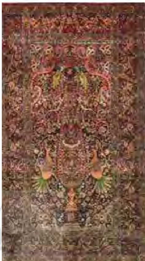
تصویر ۹- فرش کرمان با نقش ویسبوییشی محرابی، موزه فرش.