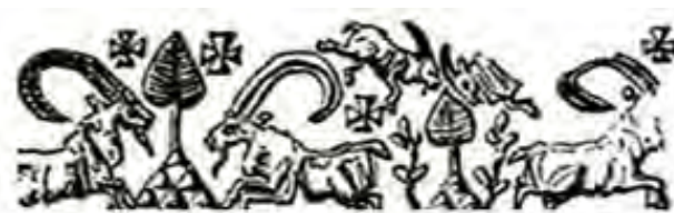
تصویر ۵- مهری از شوش، با نقش درخت سرو و بز در دو طرف آن، هزاره سوم ق.م. مأخذ: (پوپ، ۱۳۸۷، ۳۶۷)

چنان‌که پیش‌تر گفته شد از دیرباز سرو و کاج به‌صورتی نمادین با انواع نمونه طبیعی خود مشابهت داشته، و به لحاظ نمادشناسی نیز حال معتقد است درخت نماد باروری و حیات جاودانی است و در بعضی درختان و گیاهانی که برای بشر سودمند است، روحی وجود دارد (هال، ۱۳۹۰،