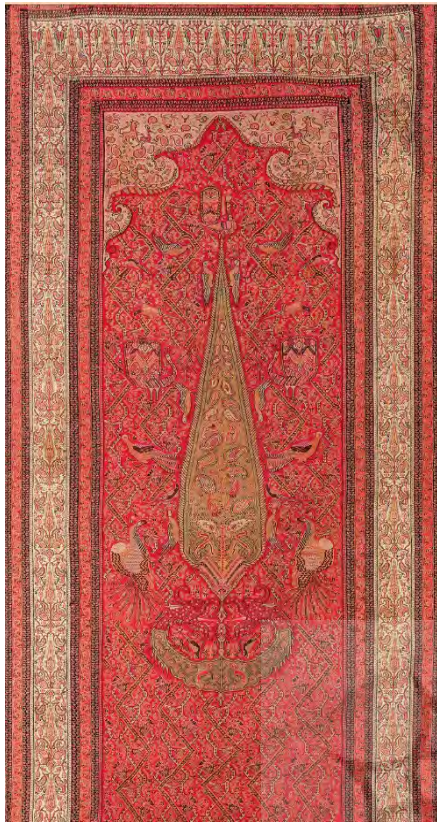
تصویر ۱- ترمه قاجاری کرمان، ۲۱۴×۱۲۲ سانتی‌متر. مأخذ: http://textileasart.com/persian-textile-2289