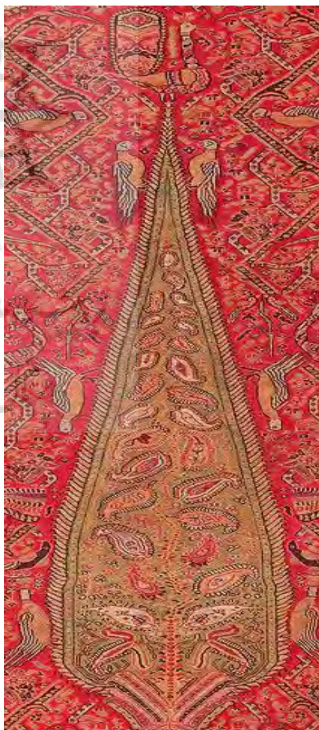
تصویر ۴- فرم‌های برگ مانند در بتن درخت.