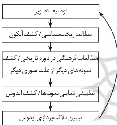
جدول ۱ - شیوه عملی اسطوره‌شناسی تمثیلی کروزر.