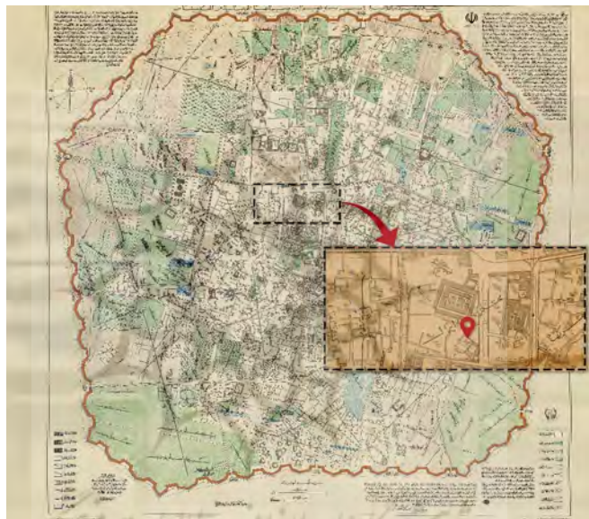
تصویر ۴. نقشه عبدالغفار خان، ۱۲۷۰ ش. / ۱۸۹۱ م.

منحل گردید. در نقشه اداره تفتیش وزارت معارف که بین سال‌های ۱۲۹۹ تا ۱۳۰۴ یعنی آخرین سال‌های حکومت قاجار ترسیم شده است، اثری از مجمع‌الصنایع اول و دوم دیده نمی‌شود و به نظر می‌رسد در این تاریخ مجمع‌الصنایع به طور کامل از فعالیت ایستاده و منحل گردیده است و احتمالاً محل مدرسه بار دیگر جهت برپایی مراسم روضه‌خوانی مورد استفاده قرار گرفت. ۱۸ در نقشه مذکور مدارس دارالفنون در ضلع جنوبی میدان سپه و صنایع مستظرفه واقع در محله دولت، در ضلع شمالی خیابان نگارستان قابل رؤیت هستند. (تصویر ۵)