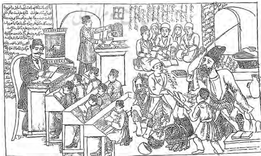
تصویر ۱. نظام آموزشی قدیم و جدید در ایران، روزنامه شکوفه، ۲۳ محرم ۱۳۱۳ق. (روزنامه شکوفه، سال نخست، شماره ۲، ص ۴. / همچنین ص ۸ از دوره جدید)

نکته دیگری که باید به آن توجه داشت، نقش پررنگ، آموزش رشته‌های نظامی، در ساختار درسی مدارس جدید بود. اهمیت رشته‌های مذکور بیشتر به سبب سابقه تاریخی نبردهای ایران و روسیه و شکست‌های پی‌درپی ارتش ایران در دوره فتحعلی‌شاه در آن جنگ‌ها بود. از سوی دیگر، وحشت ناشی از عقب‌ماندگی نظامی ایران در اندیشه نخستین بانیان مدارس جدید، که عموماً انحطاط و عقب‌افتادگی موجود را صرفاً در بعد تکنولوژیک و ساختار نظامی می‌جستند، باعث گردیده بود که در نظام جدید آموزشی، رشته‌های نظامی از بالاترین اهمیت و اولویت برخوردار باشند. به همین سبب در برنامه‌های نخستین مدارس، علوم نظری