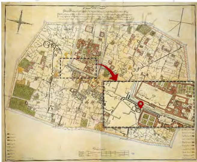
تصویر ۳. دارالخلافة طهران، نقشه کرشیش (نقشه: URL2 و تدوین و موقعیت‌نمایی مجمع صنایع اول: از نگارنده)