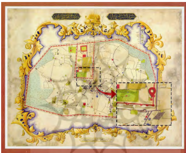
تصویر ۲. پای تخت طهران، نقشه بره‌زین، ۱۲۳۰ ش. / ۱۸۵۱ م. (نقشه از سازمان نقشه‌برداری کشور، URL1؛ تدوین و موقعیت‌نمایی مدرسه مادرشاه: از نگارنده)

ترسیم گردیده، (تصویر ۲) در این نقشه نشانی از مجمع صنایع دیده نمی‌شود، و محلی که بعدها محل مجمع خواهد شد با نام مدرسه مادرشاه مشخص گردیده است، نقشه بره زین در اواخر دوره محمدشاه و ابتدای سلطنت ناصرالدین‌شاه ترسیم شده است، در بالای نقشه عبارت «تصویر دارالخلافة طهران پای تخت شاه عالم پناه، شاهنشاه نصرالدین شاه ابن محمد شاه» و در زیر آن عبارت «بسعی کمترین بندگان الیاس بره زین منقش شد» درج شده است.