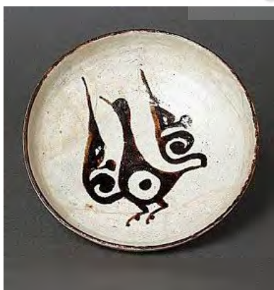
شکل ۹. نقش پرنده در قالب اسلیمی؛ کاسه خاکی مکشوفه از نیشابور، دوره ساسانی، قرن دهم، موزه هنر لس‌آنجلس، لس‌آنجلس. (تصویر: Url5)

از قدیمی‌ترین نمونه‌های نقوش بالی شکل ایران در دوره اسلامی، تعدادی از نقوش گچ‌بری است که در کاوش‌های اخیر مسجد جامع سیمره، یکی از شهرهای سده‌های اول دوران اسلامی در حوالی شهرستان دره‌شهر از توابع استان ایلام و در ۱۴۰ کیلومتری جنوب شرقی استان ایلام است. تاریخ بنای آن را اواخر دوران اموی و اوایل دوران عباسی تاریخ‌گذاری کرده‌اند. این نمونه‌های عالی گچ‌بری، از طرفی تزئینات غنی از نقوش بال‌های ساده شده در قرون اول هنر ایرانی اسلامی را نشان داده، از طرفی دیگر آغاز شکل‌گیری نقش اسلیمی را به ما نشان می‌دهند که بدون شک از نقوش ساسانی نشئت گرفته‌اند (شکل ۷). این شهر در قرن چهارم هجری بر اثر زلزله مهیبی ویران و از آن‌پس برای همیشه از منابع مکتوب رخت بر بسته است (لک‌پور، ۱۳۸۹: ۱۱۳). نیشابور یکی از مهم‌ترین شهرهای قرون اولیه دوران اسلامی ایران بوده است. کاوش‌های نیشابور، مطالب مهمی را برای تاریخ تزئینات هنر اسلامی در قرن سوم و چهارم به همراه داشته است. الواح گچ‌بری متعددی که در این منطقه یافت شده، تزئینات غنی از نقوش بال‌های بسیار ساده شده را نشان می‌دهد (شکل