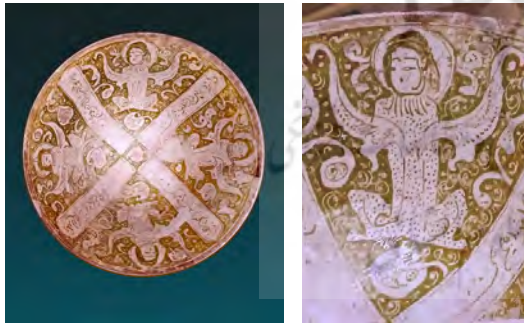
شکل ۱۱. نقش چهار فرشته، کاسه سفالی زرین‌فام کاشان، دوره سلجوقیان سده هفتم هجری، موزه آگینه تهران.

همه این نمونه‌ها، مراحل مختلف ساده‌سازی نقوش بال را نشان می‌دهند که برگرفته از نمونه اولیه ساسانی است، زمینه را برای خلق اسلیمی مهیا کرده است. این عناصر تزئینی در دوره‌های بعد نیز به رشد خود ادامه دادند و به نظر می‌رسد که به شکل فوق‌العاده‌ای تلطیف شده و به نقش اسلیمی، شاخه‌ای مهم از تزئینات در هنر ایرانی ابداع شد. نفوذ هنر باستانی یونانی - رومی ممکن است در بخش‌های از هنر غربی جهان اسلام قابل دریافت باشد، اما در بخش‌های مرکزی و شرقی جهان اسلام، نفوذ