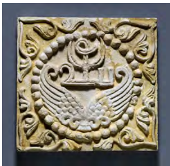
شکل ۲. نقوش بال، پلاک گچ‌بری، تیسفون، دوره ساسانی (۲۲۴-۶۴۲ پس از میلاد)، نیویورک، موزه هنر متروپولیتن.

ریگل، خاستگاه نقش اسلیمی را به گیاهی که ریشه در تزئینات نخلی و پیچک کلاسیک باستان (یونان) دارد، ارجاع می‌دهد (Riegl, 267, 1992). ارنست هرتسفلد ادعا می‌کند که منشأ آن مطمئناً از تزئینات شاخ و برگ کلاسیک گرفته شده است (Herzfeld, 363, 1938). ارنست کونل ریشه‌های نقش اسلیمی را تا اواخر دوران کلاسیک باستان دنبال می‌کند و خاطر نشان می‌کند که شکل معمولی خود را در قرن سوم هجری تحت حکومت عباسیان (۷۴۹-۱۲۵۸ پس از میلاد) به دست آورد و در قرن پنجم به طور کامل توسعه یافت (Kühnel, 561, 1960). آرتور پوپ پیشنهاد می‌کند که نقش اسلیمی ایرانی به هیچ وجه نشان‌دهنده هیچ شیء واقعی در طبیعت نیست، بلکه از زیور معماری زیبای یونانی، آنتیمون (پالمو) گرفته شده است (پوپ، ۳۹، ۱۳۵۶).