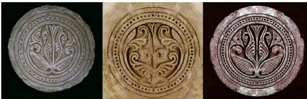
شکل ۷. نقش بال، گچ‌بری، مسجد جامع سیمره، قرن سوم، (لک‌پور، ۱۳۸۹)

۸). همچنین مقدار قابل توجهی از سفال‌های این دوره نیز در نیشابور کاوش شده است. این سفال‌ها چندین شیوه تزئینی را نشان می‌دهند. از جمله عنصر رایج بال که بسیار ساده شده و در آنها اسلوب واقعی شکل‌گیری نقش اسلیمی برداشت می‌شود. ترکیب نقش اسلیمی با نقوش حیوانی یکی از مجرب‌ترین شیوه طراحی در این دوره است. متداول‌ترین آنها نقش حیوانی است که در قالب و صورت نقش اسلیمی ترسیم شده است. رایج‌ترین آنها نقش پرندگان است. در اینجا بال‌های پرنده کاملاً به صورت نقش اسلیمی نمایش داده شده است (شکل ۹). فضای خالی روی بدن پرنده نقش مهمی در ایجاد تعادل بین شکل بال و بدن و همچنین هویت بخشی طراحی نقش در قالب اسلیمی را ایجاد کرده است. قابل ذکر است این شیوه تزئینی که فرم بال پرنده در قالب اسلیمی شکل گرفته در تزئینات منسوجات آل‌بویه هم دیده می‌شود. در طول حکومت آل‌بویه (۳۲۰-۴۵۴ هجری) حیات هنری در ایران بسیار شکوفا می‌شود. در این دوره، نقش اسلیمی به شکل توسعه‌یافته‌تری ظاهر می‌شود. نقوش بال را می‌توان در تزئینات