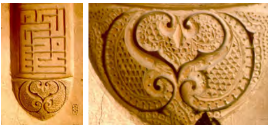
شکل ۱۲. نقش بال، گچ‌بری، بقعه پیر بکران در لنینجان، نزدیک اصفهان، سده ۸ هجری، دوره ایلخانی.