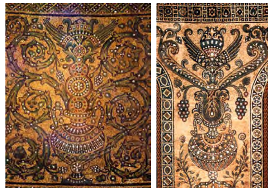
شکل ۴. نقش بال، قبه الصخره (۶۹ هجری)، دوره امویان.