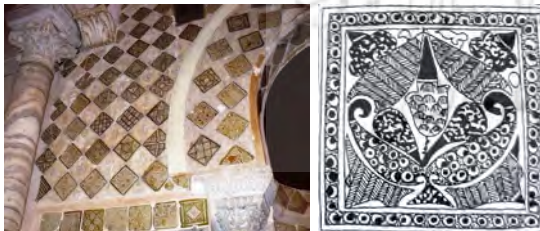
شکل ۵. کاشی‌های زرین‌فام، محراب مسجد قیروان تونس، بغداد سده سوم هجری (زمان سلطنت هارون الرشید).