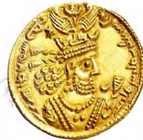
شکل ۳. سکه طلا، خسرو دوم ساسانی ۵۹۱-۶۲۸ میلادی.

مرکز خلافت در عصر عباسیان (۷۴۹-۱۲۵۸) از شهر دمشق به شهر تازه تأسیس بغداد در نزدیکی تیسفون، پایتخت ساسانیان