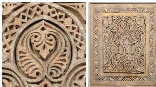
شکل ۸. نقش بالی شکل، گچ‌بری، نیشابور، سده چهارم هجری، موزه متروپلیتن نیویورک.