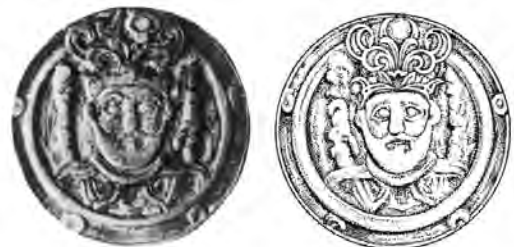
شکل ۱۰. مدال یا سکه، نقره، بویید (رکن‌الدوله) ۹۶۲ میلادی، نیویورک، انجمن سکه‌شناسی آمریکا.