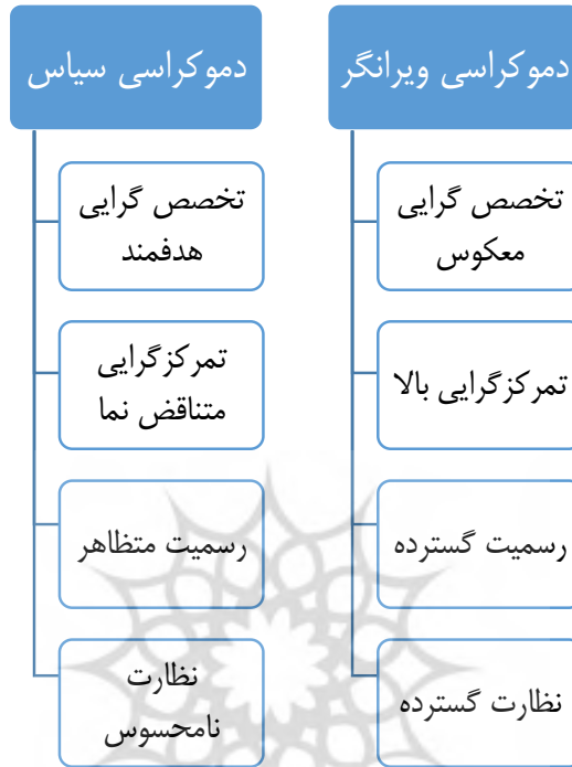
شکل ۳. ساختار سازمانی دموکراسی ویرانگر و دموکراسی سیاست (نگارندگان، ۱۴۰۱)

شکل ۳، ساختار سازمانی دو حکومت سلطنتی دموکراسی مآب یا دموکراسی ویرانگر و دموکراسی فرهیخته‌نما یا سیاست را نشان می‌دهد.