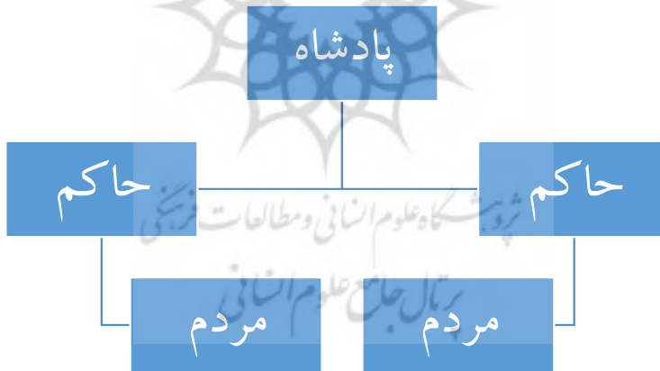
شکل ۲. توزیع قدرت در حکومتی تجددگرا (نگارندگان، ۱۴۰۱)

۱. تقسیم کشور به ایالت‌های مختلف که هر ایالت به‌وسیله حاکم منصوب از جانب دربار اداره می‌شود. این تقسیم‌بندی، با تخصّص‌گرایی بیشتر یا پیچیدگی روند اداره حکومت همراه است. این پیچیدگی در روند عمودی قدرت با ورود گروه حاکمان مشخص می‌شود. پادشاه وظیفه حاکمان را مشخص می‌کند؛ در واقع ایالت‌ها با استاندارد سلطنتی مدنظر پادشاه اداره می‌شوند. تمرکز در رأس هرم قدرت؛ یعنی پادشاه کمتر می‌شود و قدرت بین پادشاه و حاکمان توزیع می‌شود. شکل ۲، توزیع قدرت را نشان می‌دهد: