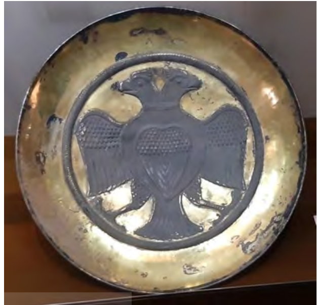
تصویر ۵. بشقاب نقره زرانود با نقش عقاب دوسر، قرن ۵ و ۶ م، دوره ساسانی، موزه رضا عباسی.

این تلفیق نقش عقاب دوسر و شاخه‌های گیاهی، علاوه بر وجه زیبایی‌شناسی؛ می‌تواند در ارتباط با پرندگان اساطیری به همراه گیاهان در مذهب و ادبیات پیشااسلامی-زرتشتی