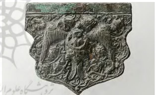
تصویر ۸. اثر فلزکاری، ایران یا عراق، ۱۲۰۰-۱۳۰۰ م، دپارتمان هنر اسلامی موزه لوور.

جدول ۲، یافته‌های حاصل از پژوهش درباره نقش عقاب دوسر در دو دوره پیشاسلامی و اسلامی در ایران را نشان