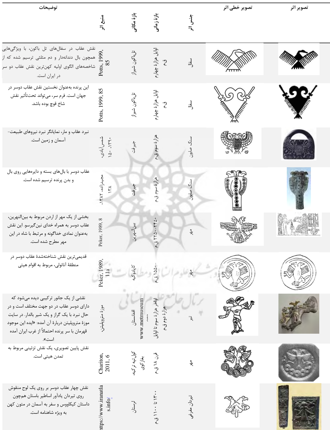
جدول ۱. سیر تحول نقش عقاب دوسر در منطقه ایران و آناتولی. مأخذ: نگارندگان.