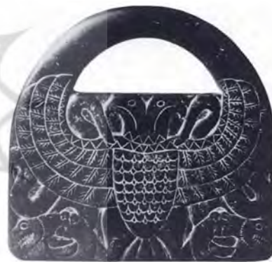
تصویر ۲. نبرد عقاب دوسر و ماران، سنگ صابون، جیرفت، هزاره سوم ق.م. مأخذ: شمس‌آبادی، ۱۳۹۰، ۱۵۰.

بین‌النهرین، هم‌زمان است. عقاب دوسر، مارانی را به چنگال خود گرفته و آنان را تحت تسلط خود دارد. مفهوم نمادین این نقش را می‌توان به ستیز خیروشهر، و مرتبط با آسمان‌وزمین دانست. در باور بسیاری از فرهنگ‌های کهن، پرنده و مار؛ هم بسیار نزدیک به یکدیگر و هم نشانگر جدایی آسمان و زمین هستند. به عبارتی، دو قطب متضاد هستند (Lurker, 1983, 21). «مارها، نماد زمین و پرندگان، نماد آسمان هستند. این شکل‌ها ایده اصلی دین کشاورزان اولیه را بازنمایی می‌کنند، به عبارتی، پیوند میان ایزدبانوی آسمان و خدای زمین را» (Golan, 2003, 99). کوپر معتقد است عقاب و مار در کنار هم، نمایانگر تمامیت وحدت کیهانی و وحدت روح و ماده هستند (کوپر، ۱۳۸۶، ۲۲۲). تصویر عقاب که ماری را به چنگال گرفته یا در منقار دارد، تصویری عالم‌گیر است؛ این تصویر نماد پیکار قدرت‌های آسمانی با نیروهای دوزخی و تضاد میان روزوشب و آسمان‌وزمین و