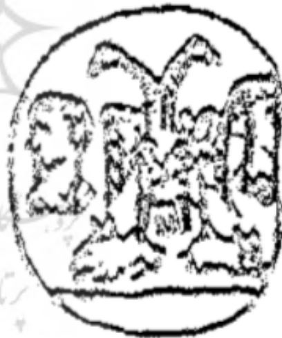
تصویر ۴. نقش یک عقاب دوسر که در هر چنگال خود خرگوشی را گرفته، دوره پارتیان (اشکانیان).