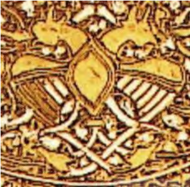
تصویر ۹. سینی، شمال غربی ایران، اواخر قرن سیزدهم م، موزه بریتانیا، لندن.