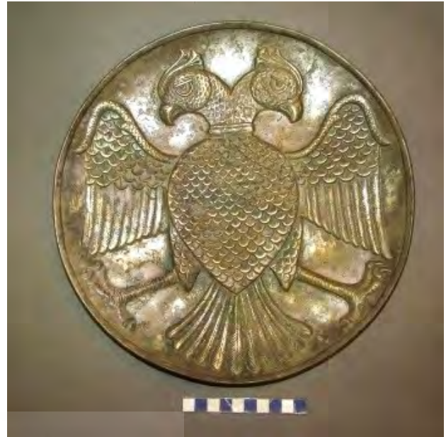
تصویر ۷. بشقاب، دوره سلجوقی، موزه آذربایجان.

آن را به عقاب و شاهین ترجمه کرده‌اند» (همان، ۷۷). در اوستا، این پرنده، مرغی با بال‌های گشوده است که در بردارنده تخمه همه گیاهان است و بر روی درختی «گئوکرن» آشیان دارد. «سیمرغ با به تعبیر اوستایی، بر بالای چنین درختی آشیانه دارد؛ درختی که حامل و باردار تمامی هستی گیاهی در کائنات بوده و در فرهنگ اسلامی به درخت طوبی تعبیر شده است» (همان، ۸۵). این مرغ در اوستا، وارغن نام دارد. «پر سپاری که در شاهنامه به سیمرغ نسبت داده شده، در اوستا به مرغ دیگری به نام وارغن منسوب شد...» (همان، ۸۸). «... شکی نمی‌ماند که وارغن یک مرغ شکاری است از جنس شاهین، باز و یا عقاب که به‌خصوص پرنده توانایی است و در ایران قدیم عقاب علم پادشاهی بوده و بعدها همین مرغ علامت اقتدار رمی‌ها شد... در شاهنامه مکرراً از علم عقاب ایران یاد شده است» (پورداوود، ۱۳۴۷، ۳۱۷). هم‌زمان با سلجوقیان در ایران و آناتولی، نقش عقاب با ترکیبی مشابه در سوریه، مصر و اسپانیا نیز دیده می‌شود. جدول ۱، سیر تحول نقش عقاب دوسر در منطقه ایران و آناتولی را نشان می‌دهد. تعدادی از نقوش، به دلیل اختصار و هم‌چنین ارتباط با هنر آناتولی در متن ذکر نشده، اما در مسیر پژوهش مورد بررسی قرار گرفته است.