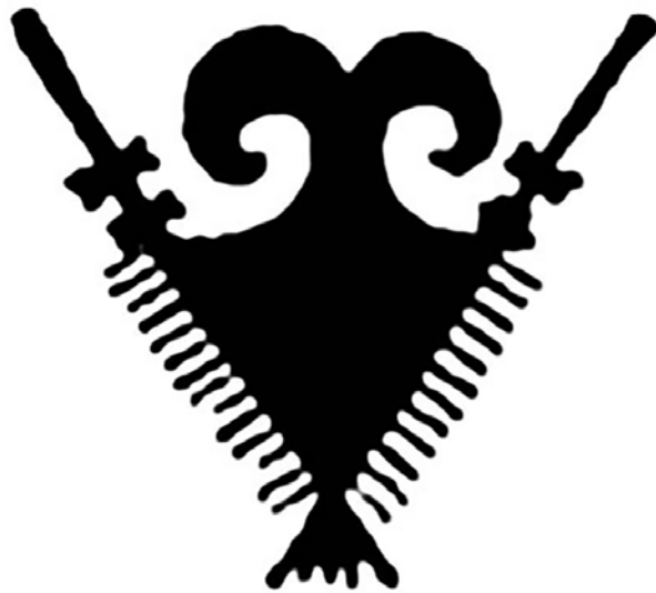
تصویر ۱. نقش یک عقاب دوسر، تل‌باکون، اوایل هزاره چهارم ق.م. مأخذ: Potts, 1999, 85.

محافظت از حامل مهر باشد (Porada, 1993, 577). در تصویر ۳، یک لوح منقوش مربوط به تیردانی از لرستان است. این لوح مربوط ۱۳۰۰ تا ۱۱۰۰ قبل از میلاد است و روی آن، نقش چهار عقاب دوسر به همراه شخصی با بال دیده می‌شود. این تصویر اسطوره‌ای را می‌توان با شخصیت کیکاووس در متون اساطیری کهن ایرانی تطبیق کرد. در شاهنامه، کیکاووس به یاری چهار عقابی که به تخت می‌بندد، موفق به پرواز می‌شود. «اسطوره پرواز کیکاووس علاوه بر متون پهلوی، اوستا و منابع تاریخی دوره اسلامی در شاهنامه نیز تبلور یافته است» (پروان و رضایی دشت‌ارژنه، ۱۳۹۸، ۷). از این‌رو می‌توان یکی از منابع سرایش شاهنامه را در اساطیر اقوام لرستان جست‌وجو کرد. براساس داستان شاهنامه پس از جنگ هاماوران و نجات کیکاووس، دیوان انجمنی برای فریب او می‌سازند و سودای این سفر را در سر او می‌اندازند. کیکاووس نیز فرمان می‌دهد تا تختی برای او بسازند تا به آسمان پرواز کند. اما پس از اوج‌گرفتن، عقاب‌ها خسته می‌شوند (فردوسی، ۱۳۹۳، ۲). شخصیت نمرود در بابل را با کیکاووس یکی دانسته‌اند (پروان و رضایی دشت‌ارژنه،