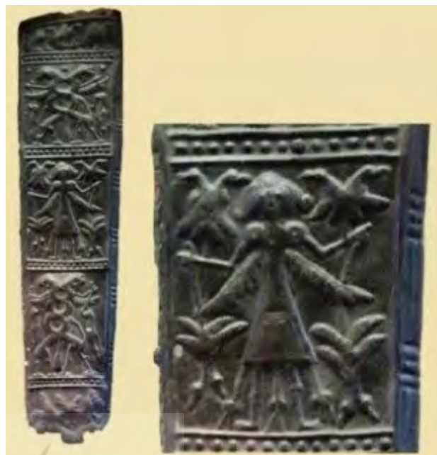
تصویر ۳. نقش چهار عقاب دوسر بر روی یک لوح منقوش روی تیردان در لرستان، ۱۳۰۰ تا ۱۱۰۰ ق.م.

نخستین بار نقش عقاب دوسر در دوره اسلامی، بر روی منسوجات دوره آل بویه در ری دیده شده است. تصویر ۶، نقش عقاب دوسر را نشان می‌دهد که انسانی را با خود به هوا می‌برد و به‌نظر می‌رسد در حال حرکت به سمت بالا است. پوپ معتقد است این شخص، همان پادشاه است. «نقش شاه بالدار روی پرنده، مفهوم رستگاری دارد» (پوپ، ۱۳۸۰، ۹۷). مشابه با ترکیب نقش انسانی در روی بدن پرنده-عقاب در آثار هنری ایران پیشااسلامی چون جام حسنلو ۷ و بشقاب نقره دوره ساسانی ۸ دیده می‌شود، احتمالاً روایتگر داستان‌های کهن است. در نمونه دوره ساسانی، پوپ و اکرمین معتقدند این زن آناهیتا است (پوپ و اکرمین، ۱۳۸۷، ۱۰۸۲). «این نقش در تصویرسازی مهرهای استوانه‌ای بین‌النهرین به ویژه دوره سلسله اولیه بسیار رایج است» (Chariton, 2011, 4). در اسطوره اتانا که منشأ بین‌النهرینی دارد، اتانا-پادشاه شهر سومری کیش به همراه یک عقاب به آسمان-بهبشت پرواز می‌کند که با این تصویر مشابهت دارد. «مهرهای استوانه‌ای دوره اکدی (۲۲۴۹-۲۳۹۰ ق.م) قطعه‌ای را نشان می‌دهد که در آن اتنه (اتانا) بر پشت عقاب به سمت آسمان صعود می‌کند» (مک‌کال، ۱۳۷۵، ۸۶). در بین‌النهرین کهن‌ترین نمایش این اسطوره بر مهرهای استوانه‌ای اکدی، مردی را نشان می‌دهد که بر بال‌های عقابی در آسمان پرواز می‌کند (مجیدزاده، ۱۳۸۲، ۷ به نقل از Frankfort, 1939, 138-139). هم‌چنان که دیده شد این نقش در دوره اشکانیان، دو خرگوش را در چنگال خود گرفته است (تصویر ۶)، اما در دوره آل بویه این جانوران در چنگال، تبدیل به گریغین می‌شود. فربود و پورعزیزی برواتی، در پژوهش خود از دو نقش عقاب دوسر بر