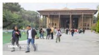
(۴- باغ چهل‌ستون اصفهان)