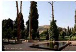
(۲- باغ جهان‌نما شیراز)