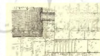
(۵- باغ چهل‌ستون بهشهر)