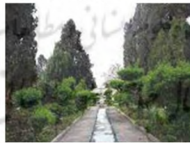
(۵- باغ چهل ستون بهشهر)