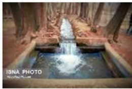
(۹- باغ بهلولان بومهریز)