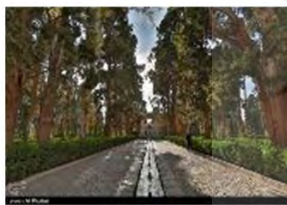
(۳- باغ فین کاشان)

دو ردیف چنار نزدیک به هم در محور اصلی باغ پهلوان پور مهریز قرار دارد که بیش از همه خودنمایی می کنند. انار، توت، انجیر و... از درختان مثمر خزان دار این باغ هستند (خلیل نژاد و توپاس، ۱۳۹۵)