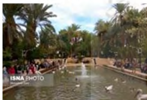
(۶- باغ گلشن طبرس)