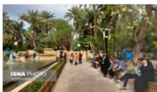
(۶- باغ گلشن طیس)