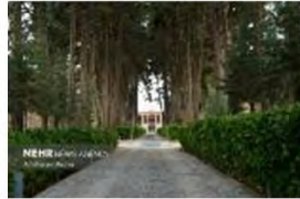
(۸- باغ اکبریة بیرجند)