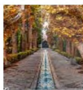
(۳- باغ فین کاشان)

آب جوششی در دو طرف کوشک و یکی از خیابان‌ها و ورودی