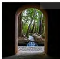
(۹- باغ بهلولان بور مهریز)