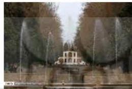
(۱۰- باغ شازده ماهان)

تصویر ۳. قسمتی از آب در خیابان‌های منتخب.