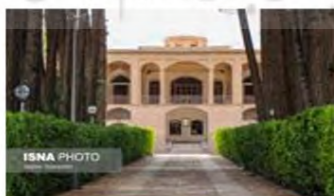
(۸- باغ اکبریه بیرجند)