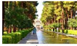
(۷- باغ دولت آباد یزد)