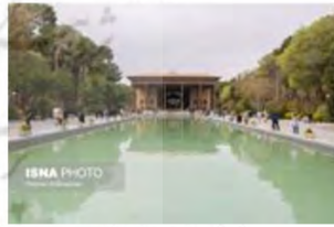
(۴- باغ چهل ستون اصفهان)