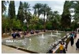
(۶- باغ گلشن طبس)