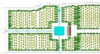
(۵- باغ چهل‌ستون بهشهر)