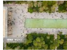
(۴- باغ چهل‌ستون اصفهان)