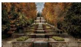
(۱۰- باغ شازده ماعان)

تصویر ۲. قسمتی از زمین در خیابان باغ‌های منتخب.