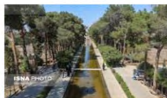
(۷- باغ دولت‌آباد یزد)