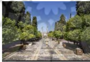
(۲- باغ جهان نما شیراز)