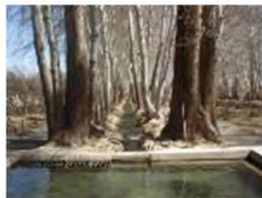
(۹- باغ پهلوان پور مهریز)