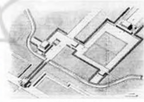
(۱- باغ باسارگاد)