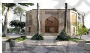
(۲- باغ جهان‌نما شیراز)