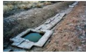
(۱- باغ پاسارگاد)