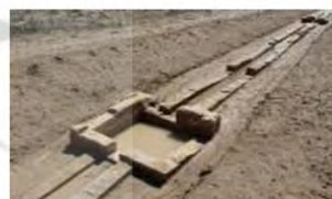
(۱- باغ پاسارگاد)