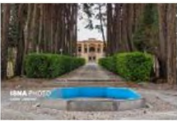
(۸- باغ اکبریه بیرجند)