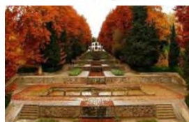
(۱۰- باغ شازده ماهان)

تصویر ۴. قسمتی از گیاه در خیابان باغ های منتخب.