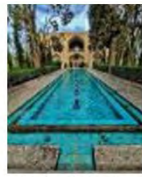
(۳- باغ فین کاشان)