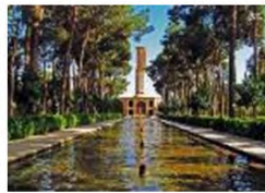
(۷- باغ دولت‌آباد یزد)