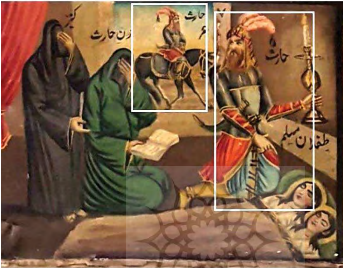
تصویر ۶. بخشی از نقاشی طفلان مسلم، اثر محمد مدبر.

این شیوه از دیرباز شیوه غالب و معمول در سنت نگارگری ایرانی بوده است. در این سنت که تا زمان قاجار به‌ویژه در کتاب‌های چاپ سنگی ادامه یافته بود، «لحظه آبیستن» در مقام صحنه اصلی قرار می‌گرفت و با توجه به موضوع روایت ممکن بود که این مرکز با خرده‌صحنه‌هایی در ارتباط با صحنه اصلی اما بدون پیش کشیدن تقدم یا تأخر زمانی پر و آکنده شود. با این حال در نقاشی قهوه‌خانه‌ای گاهی این صحنه‌ها یا نمادها به پس یا پیش از زمان وقوع صحنه اصلی نیز اشاره دارند.