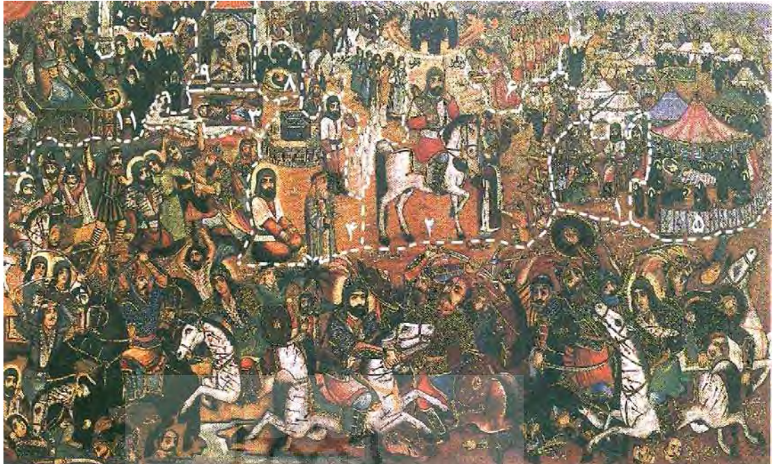
تصویر ۹. نقاشی مصیبت کربلا، اثر قوللر آقاسی، سال ۱۳۳۳ ه.ش، ابعاد: ۲۴۱×۱۳۰، محل نگهداری مجموعه فرهنگی سعدآباد

شده است. در سمت راست و پائین این نقاشی (تصویر ۸) شکار بهرام در پیش چشم گل‌اندام (فتنه) تصویر شده است. بهرام گور در پیش‌زمینه تابلو با ابعادی بزرگ درحالی‌که به‌تازگی از انداختن تیر فارغ گشته بازنمائی شده است. در قسمت پائین و در منتهی‌الیه سمت چپ آهوئی دیده می‌شود که مطابق داستان گوش و سمش به هم دوخته شده و گل‌اندام چنگ‌نواز سوار بر شتر در پشت سر شاه شاهد این رویداد است. اما در قسمت بالا و سمت چپ نقاشی روایتی را تصویر شده است که از جهت زمانی شش سال بعد روی خواهد داد. در این صحنه شاه و همراهان می‌نگرند که چگونه گل‌اندام گاو بر دوش از پله‌های قصرش بالا می‌رود. در بخشی از تابلو این دو صحنه به واسطه جویباری از یکدیگر جدا می‌شوند، علی‌رغم دارا بودن عمق، نحوه چینی و ترکیب‌بندی در تابلو به شکلی است که به نظر می‌رسد هر دو صحنه در زمینه واحدی قرار دارند. نکته قابل توجه در این نقاشی این است که آهوئی که سم و گوشش به هم دوخته شده در سوی دیگر تابلو قرار گرفته و پله‌های قصر گل‌اندام در فضایی خیالی و از میان جویبار آغاز می‌شود، گویی جدایی و پیوستگی زمانی-مکانی رویدادها به صورت هم‌زمان در اثر نشان داده شده است، یعنی درعین حال که صحنه دوم به واسطه جویبار از صحنه اصلی جدا شده در پائین صحنه پیوستگی نیز حفظ شده است. در بسیاری از آثار نقاشی قهوه‌خانه‌ای این موضوع به