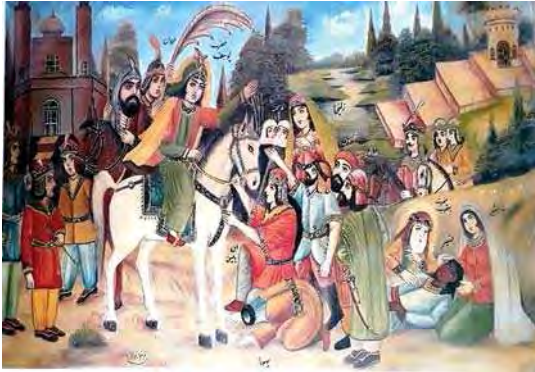
تصویر ۲. نقاشی ملاقات حضرت یوسف با برادران، رقم فتح‌الله قولر، سال ۱۳۳۰ ه. ش، مجموعه موزه رضا عباسی، مأخذ: همان، ۱۶۱:.

مسئلهٔ روایت در تصویر، گونه‌شناسی روایی خود را مطرح می‌کند. گونه‌شناسی ویکاف هموارکنندهٔ مسیری طولانی بود که تا یک قرن پس از خود پژوهشگران این حوزه را به خود مشغول ساخت (Hovarth, 2016: 252). ویکاف به روایت تصویری به شکلی استثنایی جایگاهی معتبر می‌بخشد، چنان‌که از نگاه او هر دوران تحت سیطرهٔ نوعی از روایت‌پردازی قرار دارد و تغییرات سبک هنری محصول تغییر در روش‌های روایی است (Ibid: ۲۵۳-۲۵۴).