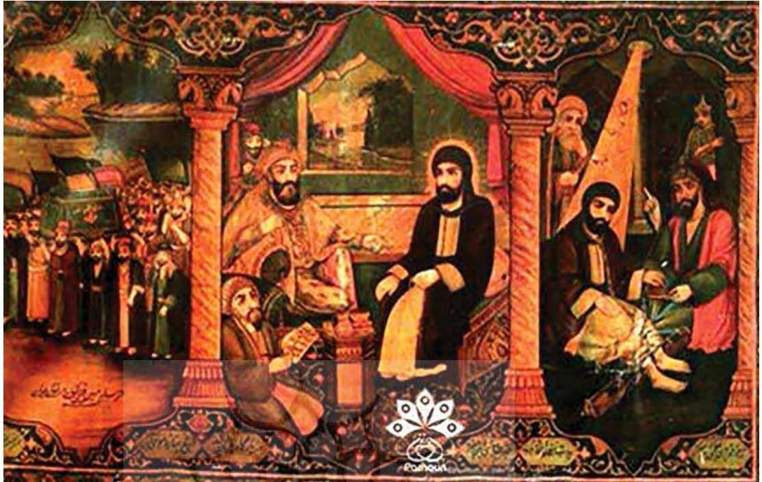
تصویر ۳. زهر خوردن امام موسی کاظم، اثر حسین قوللر آقاسی، سال ۱۳۷۱ ه.ش، ابعاد: ۲۱۴×۱۳۶ س.م، مجموعه موزه رضا عباسی، مأخذ: همان: ۷۵.

شعر) باید به مرزهای خود وفادار باشد. علی‌رغم این تفکیک و تمایز، لسینگ در رساله خود گونه‌هایی از «سازش استراتژیک» را نیز مطرح می‌کند. از نظر لسینگ «نقاشی می‌تواند از کنش‌ها نیز تقلید کند اما تنها به شکلی که از طریق فرم‌ها منتقل شود» (Lessing, ۱۹۶۹: ۱۰۳). به این ترتیب هنر مکانی، به شکلی غیرمستقیم بُعد زمانی پیدا می‌کند. از نظر لسینگ «در ترکیب‌بندی‌های همبود، نقاشی تنها می‌تواند یک لحظه واحد از یک کنش را تصویر کند و بنابراین باید یکی را انتخاب کند، آنکه از همه زیاتر است، [چنان‌که] از آن [لحظه] آنچه پیش‌تر روی داده و آنچه در شرف وقوع است به آسانی درک شود» (Ibid: ۱۰۲). سونسون ۲ در بازنمایی «لحظه آستن» ۳ در نقاشی گونه‌ای زمان‌مندی پنهان را تشخیص می‌دهد (Sonesson, ۱۹۹۵): بنابراین لسینگ بیان را به «لحظه آستن» محدود کرد؛ با این حال این لحظه امتیازی بود که به تخیل زمانی اعطا می‌شد، زیرا [این لحظه] گذشته و آینده کنش‌ها را پیش می‌نهد (Lee, ۱۹۶۷: ۲۰).