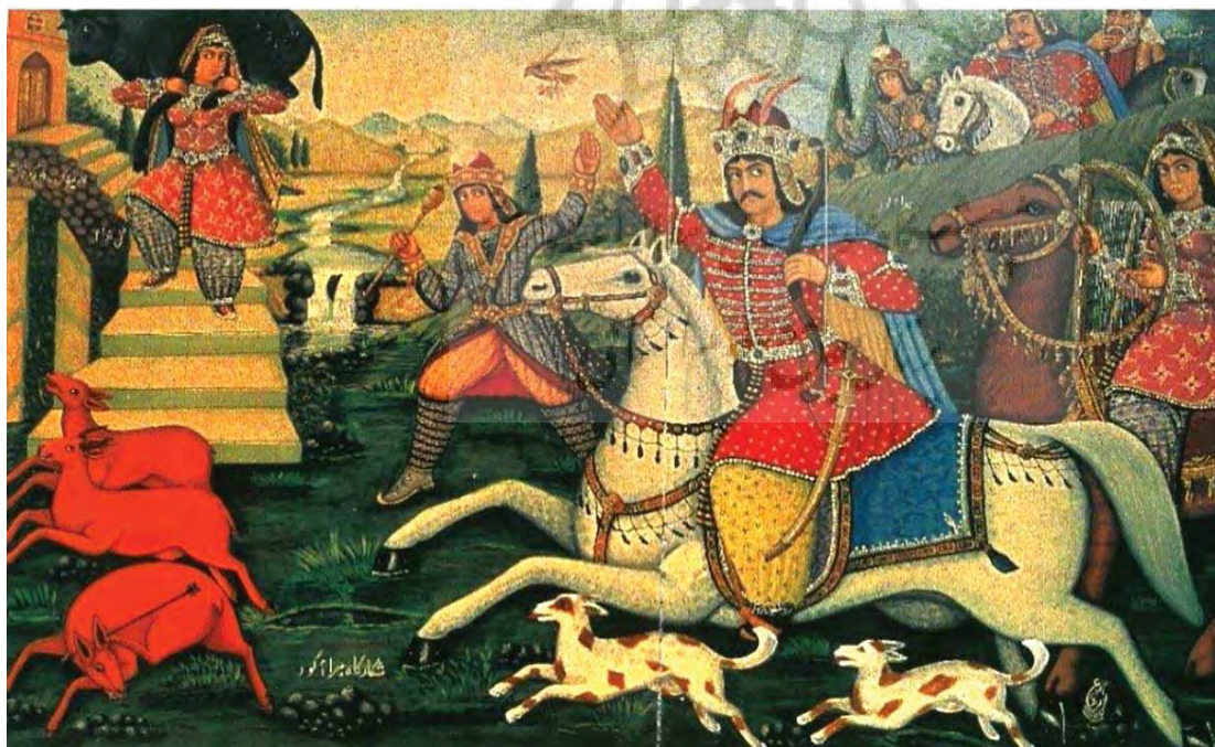
نقاشی بهرام و گل‌اندام، اسماعیل لرنی، مأخذ: سیف، ۱۳۹۴: ۶۰۲.