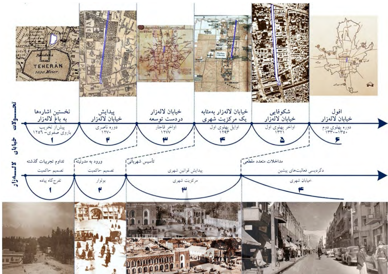
تصویر ۷. فرایند مدرنیزاسیون خیابان لاله‌زار در دوره‌های تاریخی از زمان پیدایش تا دوره پهلوی دوم. مأخذ: نگارنده.