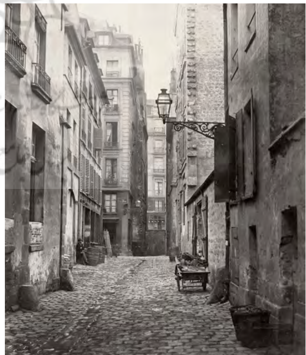
تصویر ۱. خیابان بس‌دزورسن ۱۹ پیش از احداث خیابان آرکول ۲۰ کنونی، منطقهٔ چهار پاریس، ۱۸۵۳. در این تصویر جزئیاتی چون سنگ‌فرش کف، مسیر هدایت آب‌های سطحی و روشنائی خیابان و پایه‌های فلزی دارای موتیف چراغ از مهم‌ترین اقدامات هوسمان محسوب می‌شود.