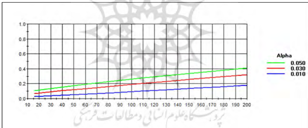
شکل ۱. برآورد حجم نمونه بر اساس توان آزمون

توزیع پرسشنامه‌ها نیز با بهره‌مندی از روش نمونه‌گیری احتمالی از نوع سیستماتیک در ساعات اوج مراجعه بانوان به این فضای عمومی انجام شد (ساعت ۱۴ تا ۲۰). لازم به ذکر است نماگرهای سنجنده، شامل ۶ گویه در بعد عمومی، ۱۰ گویه در بعد ایمنی و امنیتی، ۱۰ گویه در بعد فرهنگی-اجتماعی، ۱۰ گویه در بعد کالبدی، ۱۰ گویه بهداشتی و محیطی، ۱۰ گویه در بعد مبلمان محیط پارک و ۱۰ گویه در بعد سلامت جسمی و ذهنی است. نتایج هر آزمون به تفکیک جداول آمده است. برای سنجش پایایی ابزار پژوهش از آزمون آلفای کرونباخ استفاده شد. میزان آلفای محاسبه شده مقدار ۰/۹۲۱ را نشان می‌دهد که نمایانگر مطلوبیت پایایی پرسشنامه است. روایی پرسشنامه نیز با استفاده از روش تکنیک محتوایی و صوری انجام شده است و در این راستا روایی ابزار تحقیق به تأیید تعدادی از متخصصان حوزه تخصصی رسید.