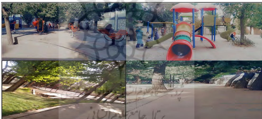
شکل ۴. تصاویری از پارک بانوان لاله