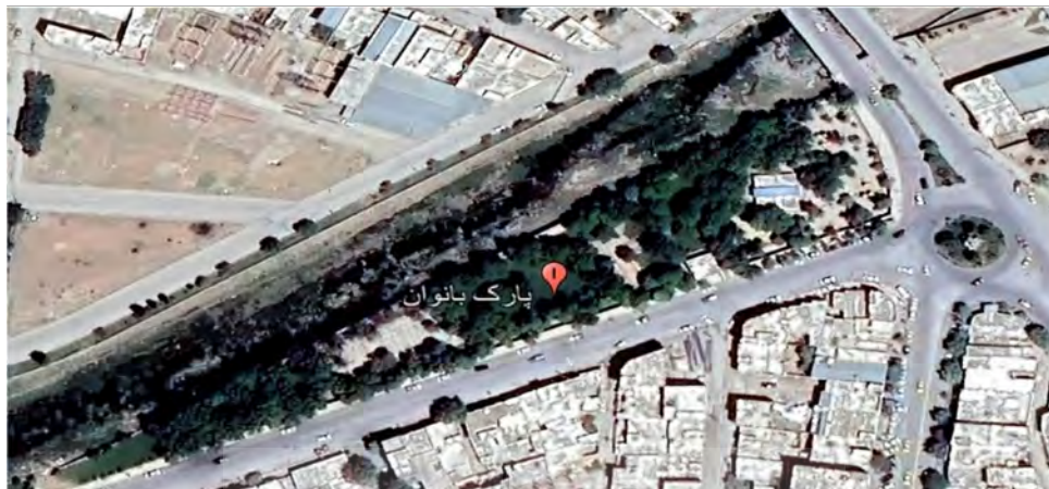
شکل ۳. موقعیت جغرافیایی پارک بانوان لاله