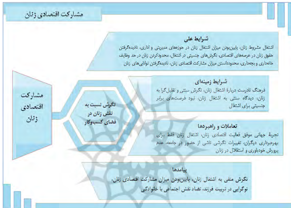
شکل ۲. مدل پارادایمی موانع مشارکت اقتصادی زنان

جنسیتی برای اشتغال، شرایطی زمینه‌ای هستند که در بروز پیامدها نقش دارند. در نهایت راهبردهایی نظیر تغییرات نگرشی ناشی از حضور زنان در جامعه و پرورش خودباوری و استقلال در زنان نیز در مدل مشاهده می‌شود.