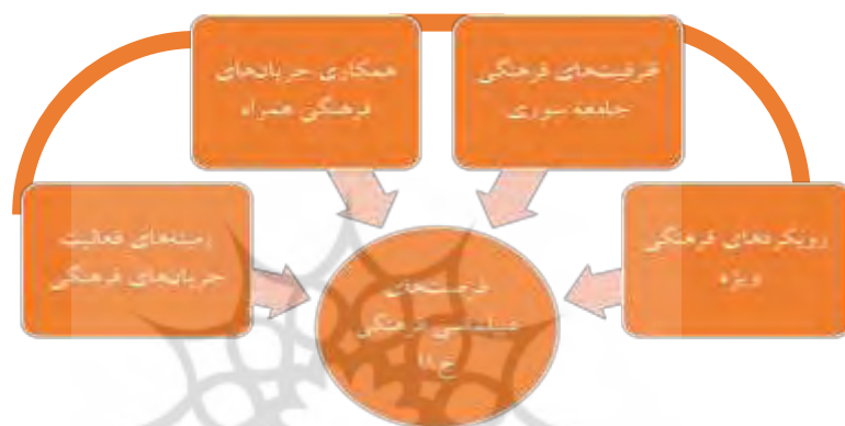
شکل شماره ۵- ساختار ارتباطی فرصت‌های دیپلماسی فرهنگی جمهوری اسلامی ایران با تأکید بر جریان‌های فرهنگی سوریه

و می‌تواند به‌عنوان یک سد محکم در برابر نفوذ استکبار، صهیونیست و جریان‌های معارض قرار گیرد. جمهوری اسلامی ایران باید پرچم‌دار این عرصه باشد. ساختار ارتباطی چهار دسته فرصت مطرح‌شده، در برنامه‌ریزی ناظر به دیپلماسی فرهنگی جمهوری اسلامی ایران در سوریه به شرح زیر (شکل شماره ۵) است: