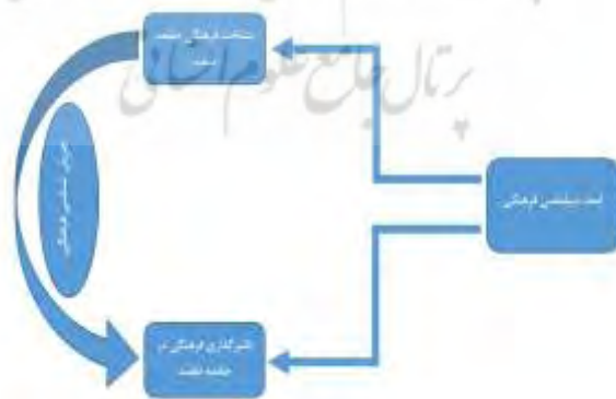
شکل شماره ۱- الگوی مفهومی پژوهش

اگر بخواهیم ارتباط بین مفاهیم گفته‌شده را به صورت یک الگوی مفهومی مشخص ترسیم کنیم در شکل شماره ۱ قابل مشاهده است: