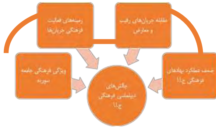
شکل شماره ۳- ساختار ارتباطی چالش‌های دیپلماسی فرهنگی جمهوری اسلامی ایران با تأکید بر جریان‌های فرهنگی سوریه

طبق این الگو چهار نوع چالش در ارتباط با یکدیگر می‌توانند چالش‌های اصلی دیپلماسی فرهنگی جمهوری اسلامی ایران در سوریه را شکل دهند. چالش‌هایی که در زمینه فعالیت جریان‌های فرهنگی وجود دارد مثل وضعیت بحرانی اکثر این زمینه‌ها به علت مشکلات اخیر سوریه، با فعالیت گسترده جریان‌های رقیب و در بعضی از موارد سیطره جریان‌های رقیب بر حوزه‌هایی مثل مساجد یا رسانه‌ها، تقویت می‌شود. از طرفی عملکرد ضعیف جمهوری اسلامی ایران دقیقاً در همان حوزه‌ها می‌تواند بر عقب‌ماندگی از صحنه رقابت فرهنگی بیفزاید و نفوذ اثرگذاری فرهنگی را به شدت کاهش دهد. در این حالت دیگر نه تنها جمهوری اسلامی ایران نمی‌تواند به‌عنوان یک بازیگر فعال فرهنگی در میدان نقش ایفا کند، بلکه به یک عنصر منفعل فرهنگی نیز تبدیل می‌گردد.