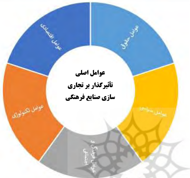
شکل ۱- مدل مفهومی پژوهش