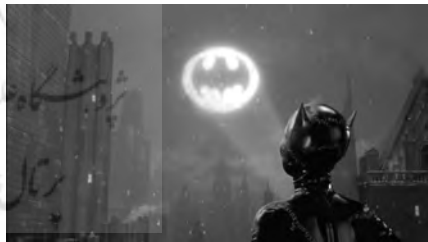
تصویر ۱۱. بتمن بازمی‌گردد (۱۹۹۲).

مؤثرترین شرور- درواقع ضدقهرمان- فیلم، کت‌وومن است، با نام اصلی سلنا کایل ۱ منشی قدرنادیده شرک که هراس ادیپی بتمن نسبت به زنان را به شکلی از اعتراض فمینیستی بروز داده و بروس را به‌رغم آزدگی از خصلت‌های آنارشسیستی‌اش، مجذوب ساخته است. فیلم قصد القای این پیام را دارد که نه پنگوئن و نه بتمن- هر