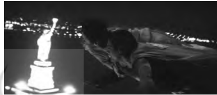
تصویر ۳. سوپرمن (۱۹۷۸).

در عوض، دشت‌های طلایی و آسمان آبی کانزاس، به تصور ما از بهشت نزدیک‌تر است و متروپولیس فیلم با غلبه طنز بر حماسه، تجلی آرمانشهری است که بنیامین معتقد به ظهور منجی موعود، به منزله باوری دینی، طرح کرد. ذات اسطوره، به هر دو جهان تعلق دارد: بلور کریپتونیت - همزمان راهنما و نابودگر - مسیر ابرقهرمان را مشخص می‌کند و لوئیس لین، همکار پرشروشور کلارک، تجسم عشق او به انسان‌ها و رسانه‌های شهری است. سکانس شاعرانه پرواز دونفره بر فراز متروپولیس - با تمام نشانه‌های توریستی نیویورک - نقطه اوج عشق آن‌ها و یادآور دیدگاه بنیامین و بودلر از افسون نورهای مصنوعی شهرهای مدرن است. در پایان سوپرمن جان میلیون‌ها انسان را نجات می‌دهد و لوتور را تحویل پلیس می‌دهد، اما به موقع به معرکه‌ای که لوئیس در آن گرفتار شده، نمی‌رسد. او با دخالت در روند تاریخ، نجات عشق زمینی را بر مسئولیت آسمانی مقدم می‌شمارد که شروعی بر وسوسه رابطه جسمانی، مضمون مرکزی قسمت بعدی است.