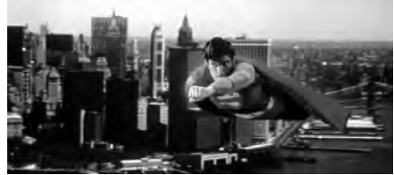
تصویر ۱. سوپرمن (۱۹۷۸).