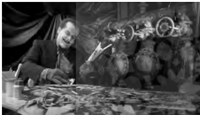
تصویر ۱۰. بتمن (۱۹۸۹).

در قسمت دوم فیلم: بتمن بازمی‌گردد (۱۹۹۲)، اسطوره‌زدایی در تشابه و تضاد قهرمان با سه شرور، خصلت التقاطی پیچیده‌تری یافته و حضور وی را تحت‌الشعاع قرار داده است. «آیا آرزوهای ساده‌لوحانه اسطوره قهرمانی در جهان فیلم‌نوآر و سیاهی که احاطه‌اش کرده، جایگاهی دارد؟» (دی پائولو، ۱۴۰۰: ۱۵۳). آنارشسیسم پنگوئن ناقص‌الخلقه، سلطه‌جویی شریک سرمایه‌دار و فمینیسم‌کت‌وومن عقده‌مند از تحقیر زنان، به‌ترتیب با یتیمی و انتقام‌جویی، فئودالیسم و وابستگی به شهر و هم‌دلی با فرهنگ پاپ در شخصیت بروس در اشتراک‌اند. برتون در تشابه با علائق بنیامین به کتاب‌های مصور کودکان، حال‌وهوایی کریسمسی را در تضاد با اقدامات شرورانه فیلم، تدارک دیده است.