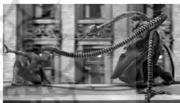
تصویر ۱۵. اسپایدرمن ۲ (۲۰۰۴).