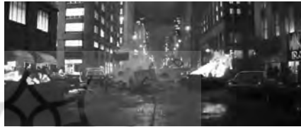
تصویر ۶. سوپرمن (۱۹۸۰).