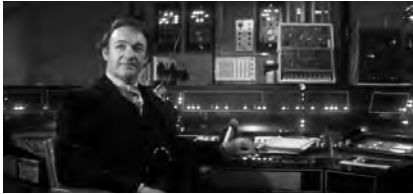
تصویر ۲. سوپرمن (۱۹۷۸). منبع: فیلم اصلی