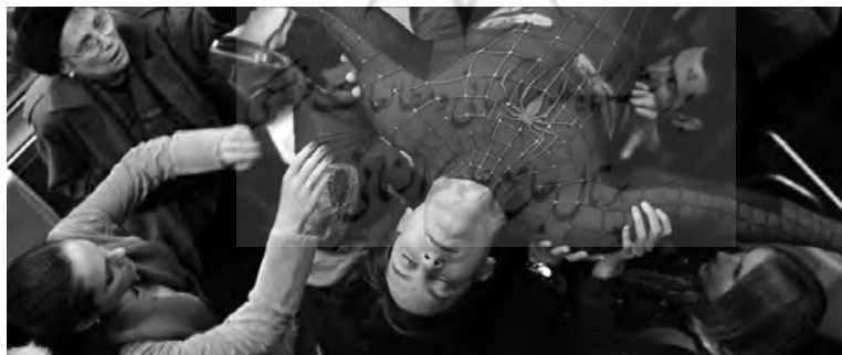
تصویر ۱۷. اسپایدرمن ۲ (۲۰۰۴).