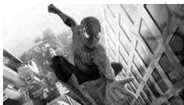
تصویر ۱۶. اسپایدرمن (۲۰۰۲).

اسپایدرمن ۲ (۲۰۰۴)، یک کم‌دی سیاه‌غناپی با محوریت شکست‌های مادی و عاطفی پیتر پارکر و از دست رفتن نمادین قدرت‌های وی است. فیلم، اسطوره‌زدایی را با گرایش ابرقهرمان به یک زندگی عادی بی‌دردسر ولی سلطه‌پذیر، روایت می‌کند. پیتر برای جبران مشکلات درسی‌اش، با دانشمندی به نام دکتر اوتو اوکتاویوس رفیق می‌شود که تحت حمایت آژورپ، دستگاهی متشکل از چهار بازوی بلند متصل به سیستم عصبی اختراع کرده که مثل خورشید، انرژی سالم در بدن ایجاد می‌نماید؛ اما زمان زیادی سپری نمی‌شود که اوکتاویوس، با اشاره به بیهوشی تی. اس. الیوت، شاعر و نویسنده نقاد مدرنیته، قربانی اشتباهات محاسباتی خودش شده و به شروری با بازوهای موج‌ویرانگر- اوکتاویوس مترادف لاتین اختاپوس است- بدل می‌گردد. هیولایی قابل ترحم- تداعی ضحاک یا نرون- که زاینده علم و سرمایه‌داری و ویران‌کننده جامعه مدرن است.