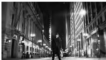
تصویر ۱۴. شوالیه تاریکی (۲۰۰۸).

دو با میراث سرمایه‌داری سنتی - قادر نیستند شریک - سمبل سرمایه‌داری نوکیسه - را نابود کنند و سلنای طبقه فرودست، قادر به انجام آن است. همانطور که «بیزاری بنیامین از سرمایه‌داری، رها از منش رمانتیک نبود» (احمدی، ۱۳۸۰، ۱۶)، احساس همدردی بتمن با سلنا، به سان نظاره‌گری رمانتیک با خاستگاه فئودالی باقی می‌ماند. لذا در پایان، مفاهیم سیاسی به نفع رومانتیسیسم ذاتی شخصیت کنار گذاشته می‌شود و بروس به سان پرسه‌زن بنیامین در شهری که خیال، تناسخ و همدلی را در هم می‌آمیزد، گربه‌ای خیابانی را به جای کت و وومن در آغوش می‌گیرد.