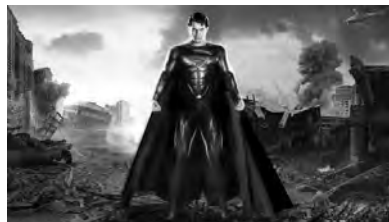
تصویر ۸. سوپرمن بازمی‌گردد (۲۰۰۶).