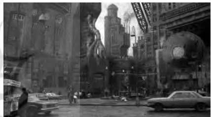
تصویر ۹. بتمن (۱۹۸۹).