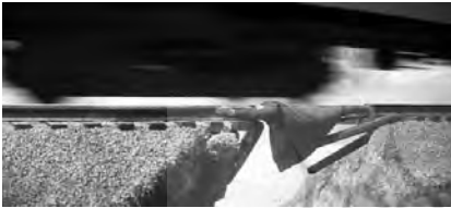
تصویر ۴. سوپرمن (۱۹۷۸).