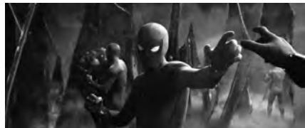
تصویر ۱۸. اسپایدرمن: دور از خانه (۲۰۱۹). منبع: فیلم اصلی

در اسپایدرمن: راهی به خانه نیست (۲۰۲۱)، اظهارات ویدئویی کوئنتین، باعث بدنامی اسپایدرمن و لو رفتن هویت واقعی‌اش می‌گردد و او این بار به فلسفه واقعی جهان‌های موازی زیر نظر دکتر استرنج، ابرقهرمان دیگر مارول، پناه می‌برد تا هویت پیتر پارکر را از اذهان پاک کند. این امر به خطرناک‌ترین آزمون زندگی اسپایدرمن منتهی می‌شود: بازگشت اشرار فیلم‌های قبلی، از دست رفتن دردناک زن عمومیش، فراموش شدن در ذهن نزدیکان و تنهایی ابدی او که تعلق جاودانه‌اش را به مردم و شهر به ارمغان می‌آورد.