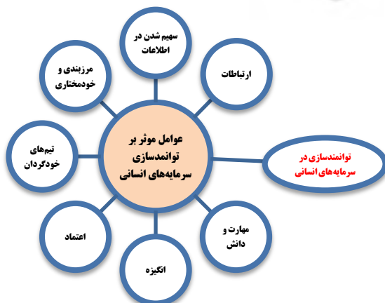
شکل ۱- مدل مفهومی تحقیق ارائه‌شده (بر اساس مدل بلانچارد و همکاران (۲۰۱۳))

مدل مفهومی تحقیق توانمندسازی سرمایه‌های انسانی بخش تعاون: مدل مفهومی این تحقیق به‌صورت شکل (۱) ترسیم می‌گردد.