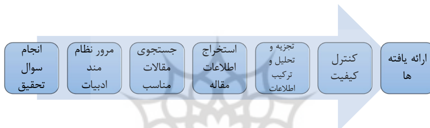
شکل ۱. گام‌های فراترکیب سندلوسکی و باروسو

است. تکنیک اصلی مورداستفاده در این پژوهش، مصاحبه است. از این روش تحقیق به کاررفته شده در این پژوهش، ترکیبی از روش‌های کمی و کیفی است که به روش پژوهش آمیخته است. از روش فراترکیب به منظور شناسایی عوامل کلیدی دانش بازاریابی در مناطق آزاد تجاری استفاده شده است. به منظور تحقق این هدف، از روش هفت مرحله‌ای سندلوسکی و باروسو (۲۰۰۷) استفاده شد که خلاصه این مراحل در شکل زیر نشان داده شده است: مرحله‌ای سندلوسکی و باروسو (۲۰۰۷) استفاده شد که خلاصه این مراحل در شکل زیر نشان داده شده است: