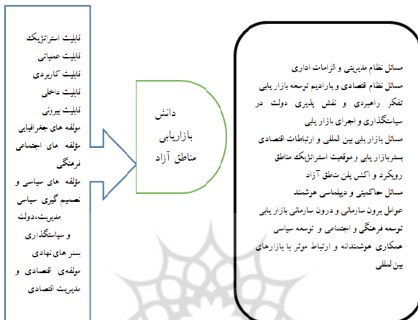
شکل ۳. مدل ارائه شده برای دانش بازاریابی مناطق آزاد تجاری

اهمیت این موضوع با در نظر گرفتن دلایل زیر دوچندان می شود. تأثیر مناطق آزاد بر رشد اقتصادی کشورها بسیار چشمگیر است. در این پژوهش ۱۰ مقوله محوری، ۶۵ مفهوم و ۲۸۳ کدنهایی مشخص شد.