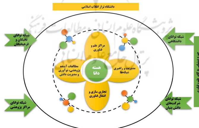
شکل ۲. الگوی هسته دانا - شبکه توانا برای نقش آفرینی دانشگاه ها در مدیریت دانش نظام مسائل تمدن نوین اسلامی

از سوی دیگر اکثر پژوهش های پیشین در مورد همکاری و تعاملات دانشگاه با جامعه، تجزیه و تحلیل چنین مشارکت هایی را بر اساس نتایج پروژه های تحقیقاتی تعریف کرده و به عنوان یک نتیجه برای یک شرکت، مانند راهنمایی برای جهت گیری توسعه فناوری، تعریف شده اند. اما آنچه مهم است نتیجه نیست، بلکه تأثیر است؛ اینکه چگونه دانش جدید حاصل از همکاری و تعامل یک دانشگاه با جامعه می تواند به عملکرد بخش های مختلف جامعه کمک کند؛ بنابراین، تمرکز تحقیق ما بر چارچوب همکاری و تعاملات دانشگاه با جامعه مبتنی بر تأثیر همکاری بر روی جامعه است. این مقاله به طور خاص به این موضوع پرداخته و به دنبال کشف چارچوب این همکاری ها برای رسیدن به بهترین نحو از توافقات انجام شد.